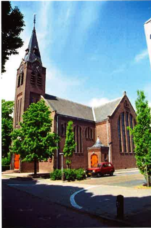
Marekerk (1913) van de protestantse gemeente De Meern.

dienste van de plaatselijke gemeenten die deel uitmaken van de afdeling Utrecht van de Vereniging voor Kerkrentmeesterlijk Beheer.