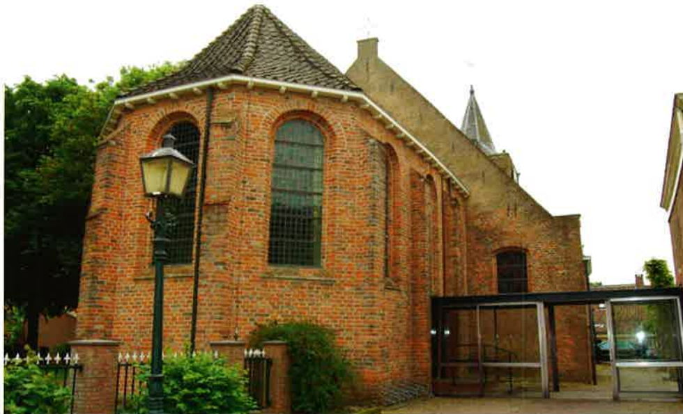
Grote of St. Janskerk (1482) van de hervormde gemeente te Linschoten.

De heer Van Hazel stond stil bij de financiële problemen waarmee steeds meer gemeenten te maken krijgen. Als gevolg van de secularisatie werden de collecteopbrengsten minder, terwijl door de geldontwaarding de kosten jaarlijks fors stegen. Dat was voor de generale synode van de Nederlandse Hervormde Kerk aanleiding een Commissie Geldwerving in te stellen om de plaatselijke geldwerving te gaan stimuleren. Een van de belangrijke uitgangspunten is dat er in de kerkenraad draagvlak gevonden moet worden om deze aangelegenheid af te stemmen met o.m. de diaconie en de Commissie zending en werelddiaconaat die gemeenteleden ook benaderen voor een bijdrage.