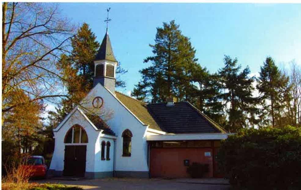
De Kapelkerk (1916) van de protestantse gemeente te Maarn-Maarsbergen.