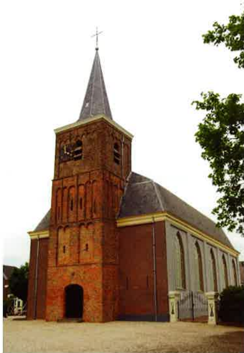
Kerkgebouw (1824) van de hervormde gemeente Polsbroek en Vlist.

Het hoofdbestuur is graag bereid zijn bemiddeling hierbij te verlenen.