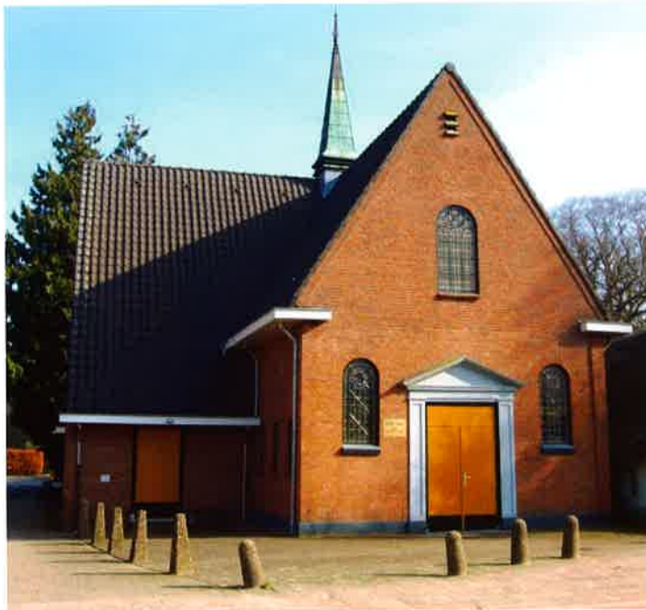
Gereformeerde kerk (1936) van Nieuw-Loosdrecht.

Na afloop van de bijeenkomst van 9 februari 1985, die niet door de voorzitter van de afdeling Utrecht kon worden bijgewoond, wordt verslag uitgebracht. Teleurgesteld wordt gereageerd op de houding van het hoofdbestuur dat de kant dreigt te kiezen van de AKR. Degenen