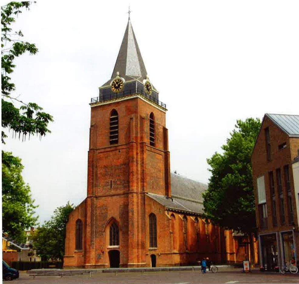
Grote of Petruskerk (14 e eeuw) van de hervormde gemeente te Woerden.

heer, werd aangepast. Maar welk soort beheer was dat, want de Kerk kende tot 1991 drie vormen van kerkvoogdelijk beheer, te weten: