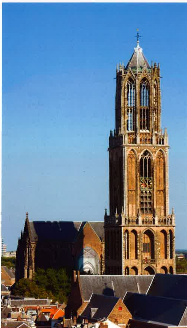
Dom- of Sint Maartenskerk (13 e eeuw) van de protestantse gemeente Utrecht.

beschikbaar is gesteld, namelijk f 800.000 en gaat uit van een bedrag van f 22 miljoen voor de restauratie van alle vijf kerken. Volgens de heer Zeevalking is dit standpunt niet reëel, omdat hiermee geen rekening met de prijsindex wordt gehouden. Hij verwacht problemen als men gaat beginnen aan de Domkerk, de Buurkerk en de Janskerk. Als het beleid dan niet ten gunste omgebogen wordt, zou er wel eens ernstige vertraging in het herstel van deze drie kerken kunnen ontstaan.