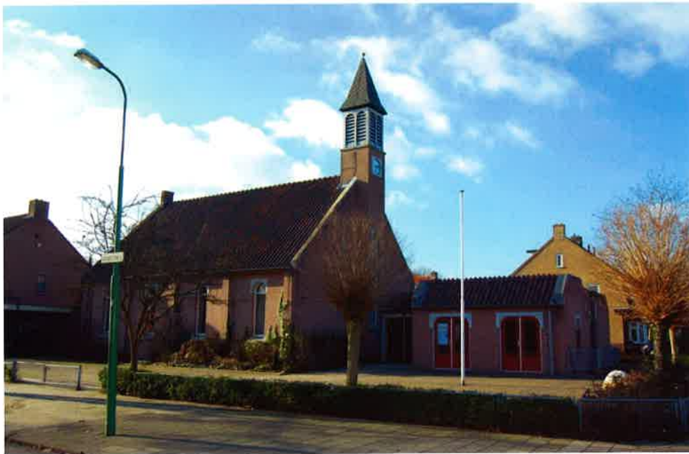
Kerkgebouw "De Hoeksteen" (1984) van de protestantse gemeente Austerlitz.

Daarna ontwikkelde de kerkelijke gemeente zich zodanig dat het noodzakelijk werd het gebouw met enkele lokaliteiten uit te breiden. Er komt een kapel waarin zowel de vroegdiensten als de rond-de-15-diensten, het zaterdagavondgebed, kleine trouwdiensten e.d. gehouden kunnen worden. De kapel krijgt een afmeting van 8 x 14 m, zodat er voor circa 150 personen plaats zal zijn. Voorts is in de verbouwing opgenomen de inrichting van een ontvangsthuis van 65 m 2 . Het ontwerp voor deze uitbreiding is gemaakt door ir. G. Pothoven uit Amersfoort.