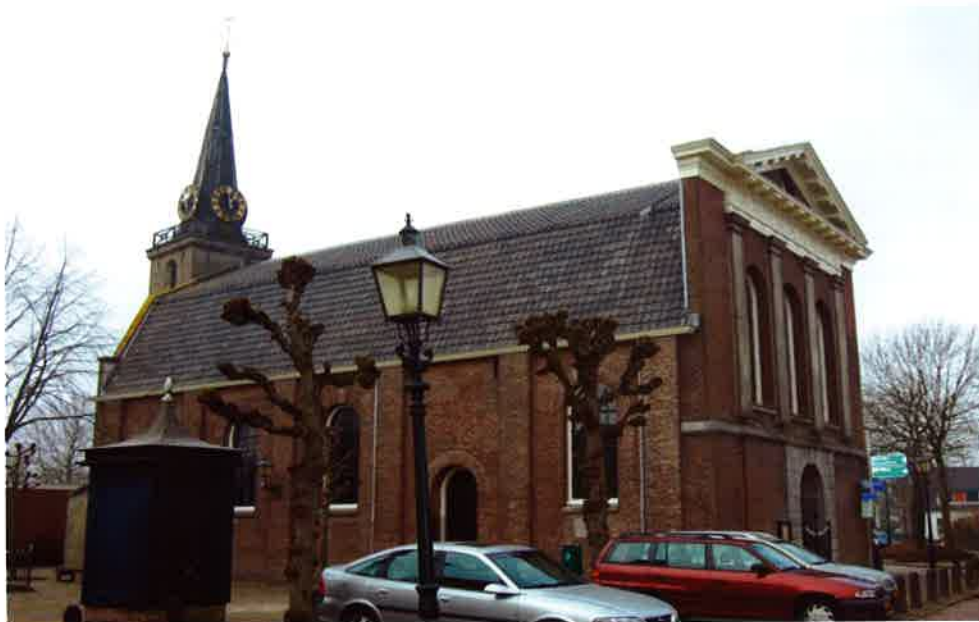
Dorpskerk (1844) van de hervormde gemeente Baambrugge.

Naast “Het Maandblad” zal het hoofdbestuur via een Contactorgaan voorlichting geven over zaken die in het bijzonder zijn gericht op de praktijk van het kerkvoogdijwerk. Het hoofdbestuur doet de volgende suggesties aan de afdelingsbesturen om hun werkwijze te veranderen: