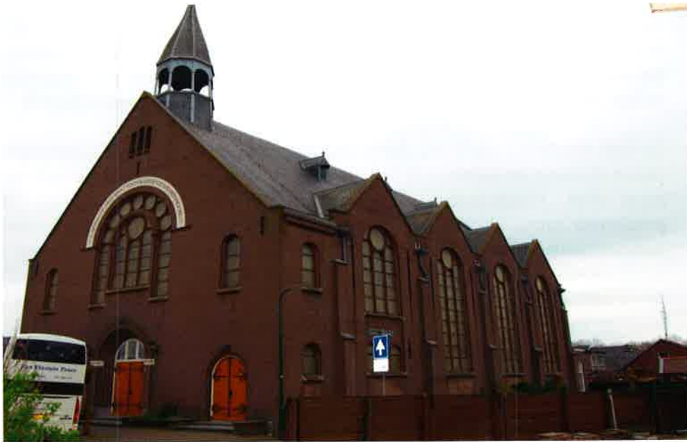
Zuiderkerk (1914) van de gereformeerde kerk Bunschoten.

Blijkbaar heeft de PKV de brief van juni 1974 niet aan het bestuur van de afdeling Utrecht verzonden, want uit de notulen van die periode blijkt niet dat het bestuur zich over deze aangelegenheid heeft uitgesproken.