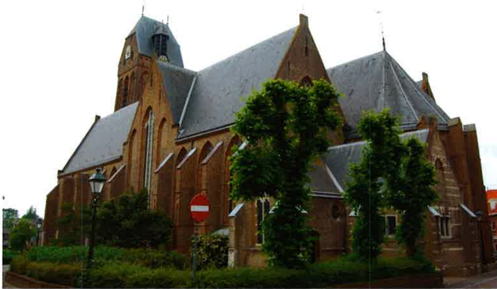
Grote of Sint Michaëlskerk (15 e eeuw) van de hervormde gemeente te Oudewater.