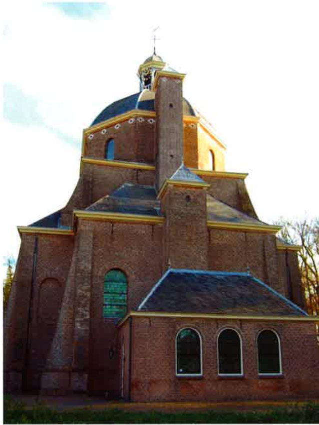
Koepelkerk (1640) van de hervormde gemeente te Renswoude.

huidige regeling is ontstaan. Vervolgens gaf hij aan hoe naar zijn mening het beheer voor de komende jaren geregeld behoort te worden. Hij wees er o.m. op dat de generale synode zich eigenlijk al met het beheer bemoeit doordat er tijdens de dienst collecten voor de eigen gemeente gehouden worden. In het kader van de nieuwe kerkorde, waarvoor enkele buitengewone klassicale vergaderingen werden gehouden, werden de beheerscolleges uitgenodigd, maar