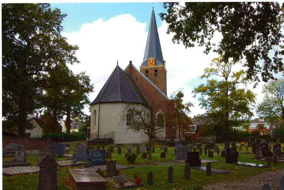
Kerkgebouw (14 e eeuw) en begraafplaats van de hervormde gemeente te Nederlangbroek.