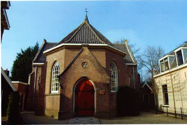
Gereformeerde kerk van Loenen aan de Vecht (1923).