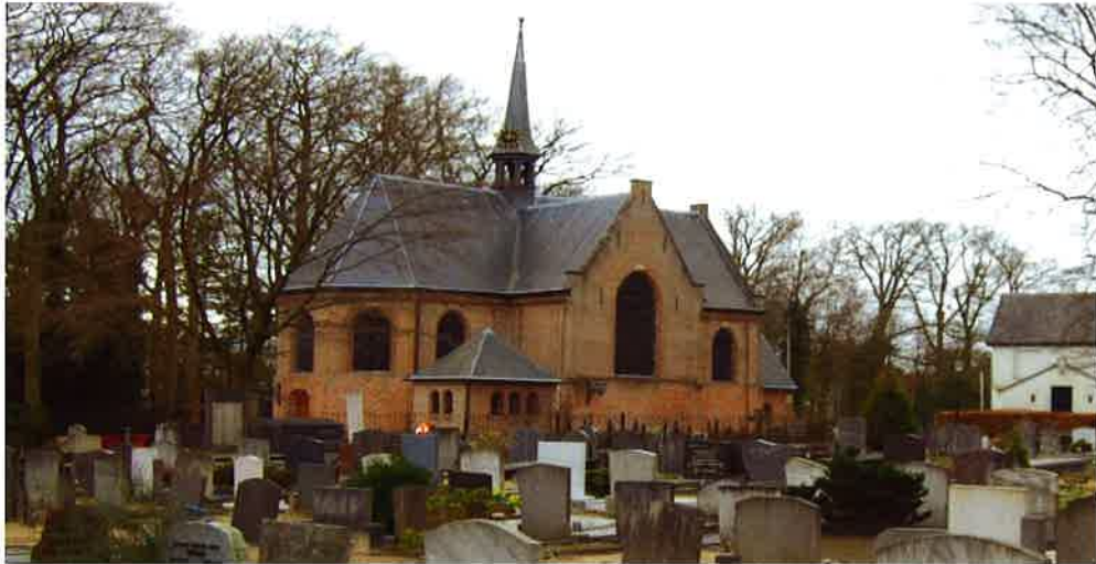
Kerkgebouw De Stulp (1659) en begraafplaats van de hervormde gemeente Lage Vuursche.