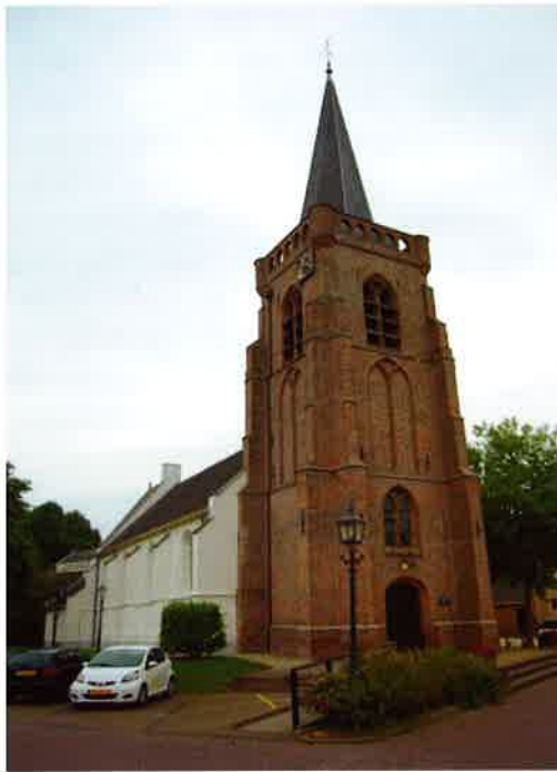
Hervormde kerk (15 e eeuw) te Jaarsveld.

Johannes Bogermanschool en 's middags in de Pleinkerk. Op 19 november 2008 betreft deze gemeente haar nieuwe kerkgebouw, die de naam Sionkerk krijgt. De gemeente heeft op dat moment ongeveer 600 leden en doopleden. De vorming van de Protestantse Kerk in Nederland in 2004 trok ook haar sporen in Houten. De hervormde wijkgemeente Pleinkerk besluit niet mee te gaan in de fusie tot de Protestantse Kerk in Nederland en sluit zich in meerderheid aan bij de Hersteld Hervormde Kerk. Een aantal leden van de wijkgemeente Pleinkerk, dus de Hervormde gemeente van Houten, zet deze gemeente voort en houdt in de jaren 2007 en 2008 kerkdiensten in de Pleinkerk. Op 14 mei 2009 voegt de classis Utrecht de hervormde wijkgemeente Pleinkerk samen met de Hervormde wijkgemeente Sion (van bijzondere aard) tot de hervormde gemeente Houten. De samenvoeging houdt onder andere in dat de ledenbestanden van beide (wijk)-gemeenten zijn samengevoegd.