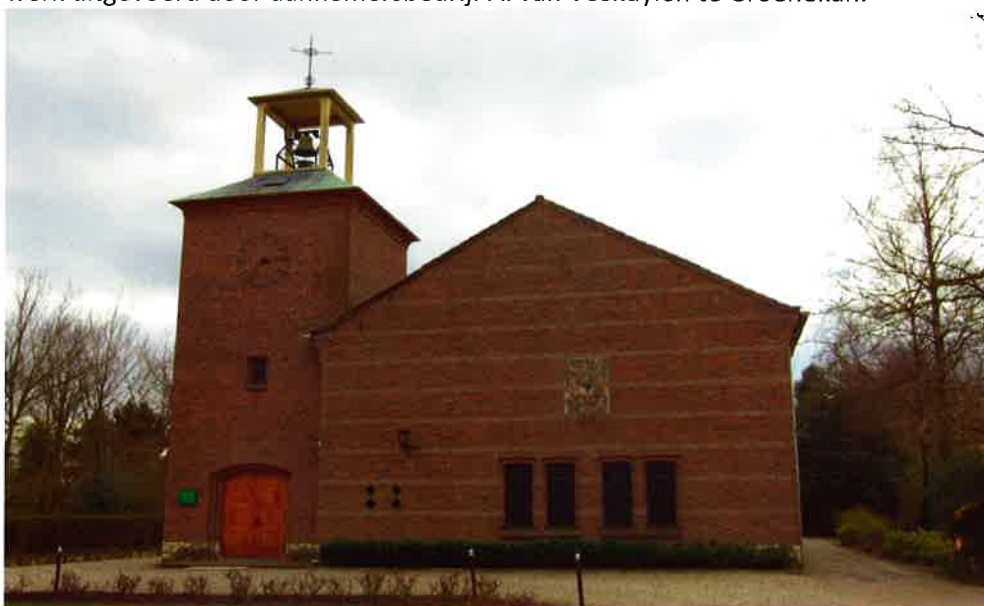
Kerkgebouw (1953) van de hervormde gemeente Blauwkapel-Groenekan.

Op 16 maart 1953 werd begonnen met de bouw van de nieuwe hervormde kerk te Groenekan die in de plaats komt van de door de oorlog verwoeste kerk. Onder leiding van architectenbureau G. en ir. T. van Hoogevest te Amersfoort wordt het werk uitgevoerd door aannemersbedrijf A. van Voskuyl te Groenekan.