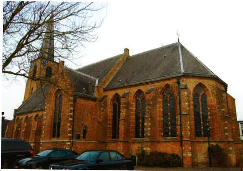
Kerkgebouw (15 e eeuw) van de hervormde gemeente te Kockengen.

Bij die gelegenheid zijn drie gebrandschilderde ramen aangebracht. Als geschenk van de provincie Utrecht, een raam dat Mozes en Jozua voorstelt. Het tweede raam, geschonken door de stad Utrecht, stelt de Ark van Noach voor en het derde