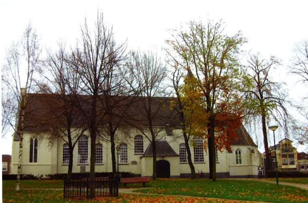
De Oude of Salvatorkerk (1566) van de hervormde gemeente te Veenendaal.