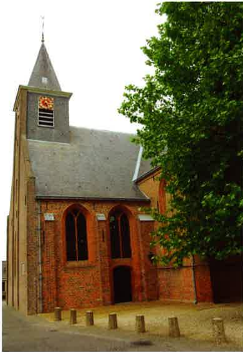
Salvatorkerk (1469) van de hervormde gemeente Lopik.