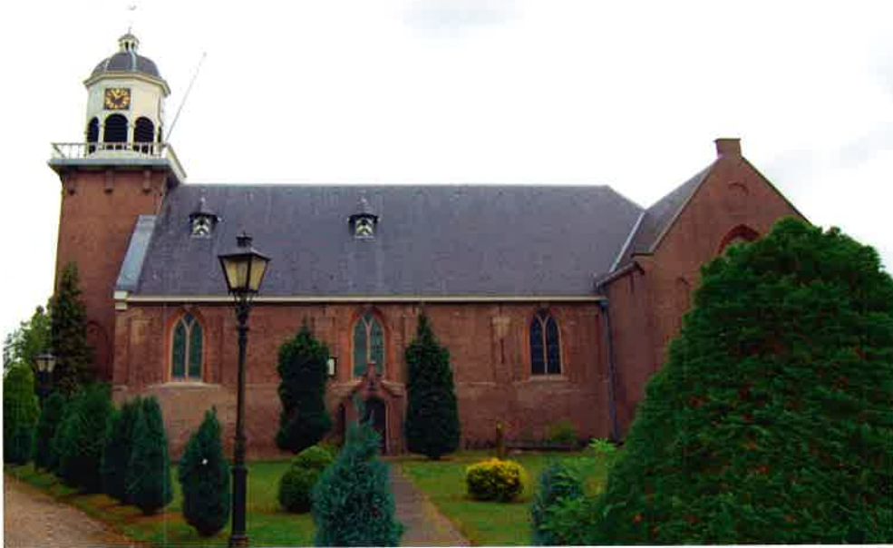
Dorpskerk (1652) van de hervormde wijkgemeente die deel uitmaakt van de protestantse gemeente te De Bilt.

Eind april 2002 werd het 350-jarig jubileum tijdens een speciale kerkdienst herdacht.