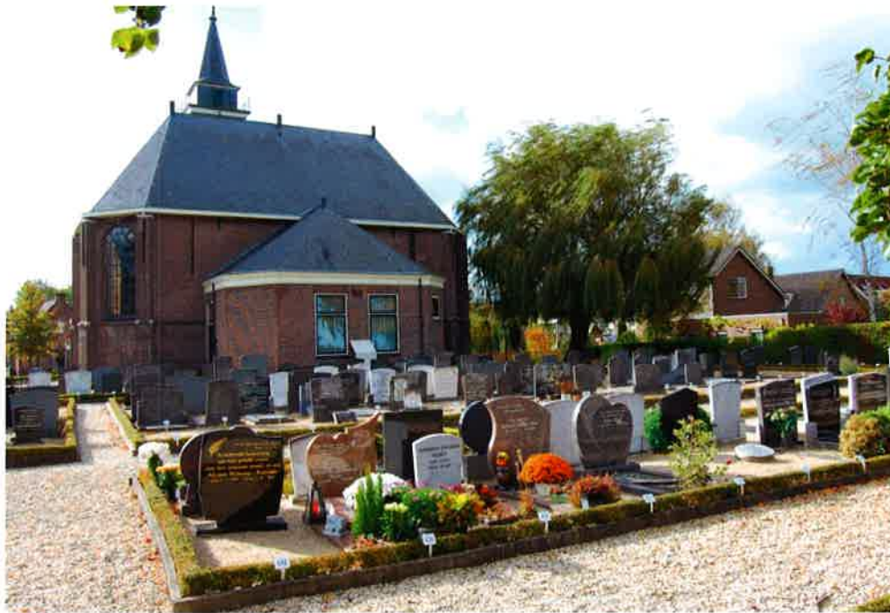
Kerkgebouw (1862) en begraafplaats van de hervormde gemeente te Zegveld.

In oude statuten van de Vereniging van Kerkvoogdijen was, toen de VVK vanaf 1946 een eigen Centraal Bureau had, in artikel 1 vermeld dat zij op 9 juni 1920 opgericht was in Utrecht, maar haar kantoor in Dordrecht houdt. De locatie