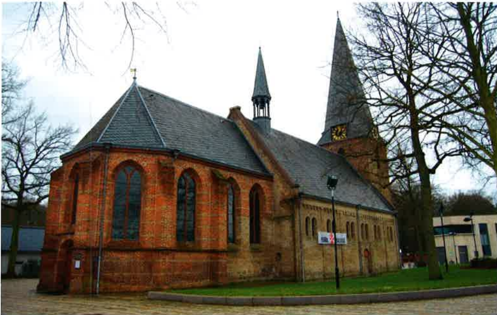
Maartenskerk (1200) van de protestantse gemeente van Doorn. Deze kerk is één van de oudste kerken in de provincie Utrecht.

Sinds 1984 zijn de ruimten voor kerkelijke activiteiten geconcentreerd rond de Maartenskerk. De oude kapel aan de Langbroekerweg werd afgestoten en een nieuw zalencentrum "De Koningshof" werd achter de kerk gebouwd. Dat was in de eerste plaats om te voorzien in de behoeften van de hervormde gemeente en daarnaast voor allerlei nevenactiviteiten, zoals bijeenkomsten, vergaderingen, lezingen e.d. door andere organisaties.