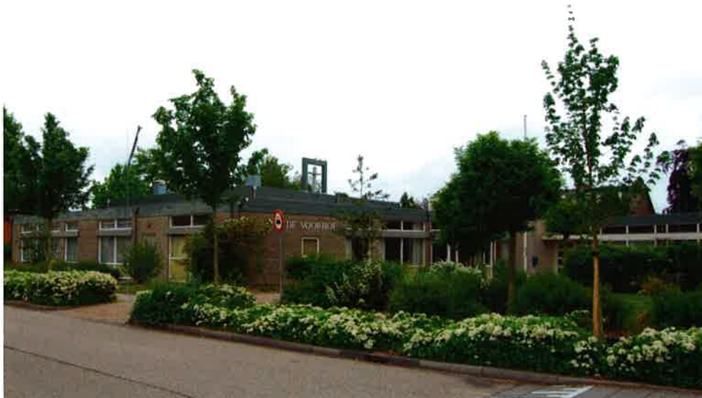
Kerkelijk centrum (1976) protestantse gemeente "De Voorhof" te Woudenberg.

ongeorganiseerd optreden, doordat afzonderlijke kerkvoogdijen of personen zich tot kerkvoogdijen wendden door hen te adviseren hun plaatselijk reglement niet aan de bepalingen van de nieuwe kerkorde aan te passen.