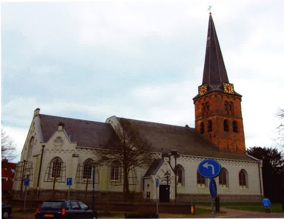
Pauluskerk (14 e eeuw) van de hervormde gemeente te Baarn.