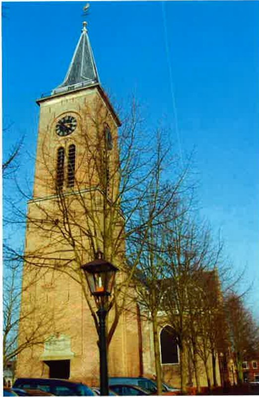
Pieterskerk (15 e eeuw) van de hervormde gemeente Breukelen.

de Generale Kas werd f 175.000 ontvangen, terwijl de gemeente zelf door individuele giften en activiteiten f 110.000 bijeen bracht.