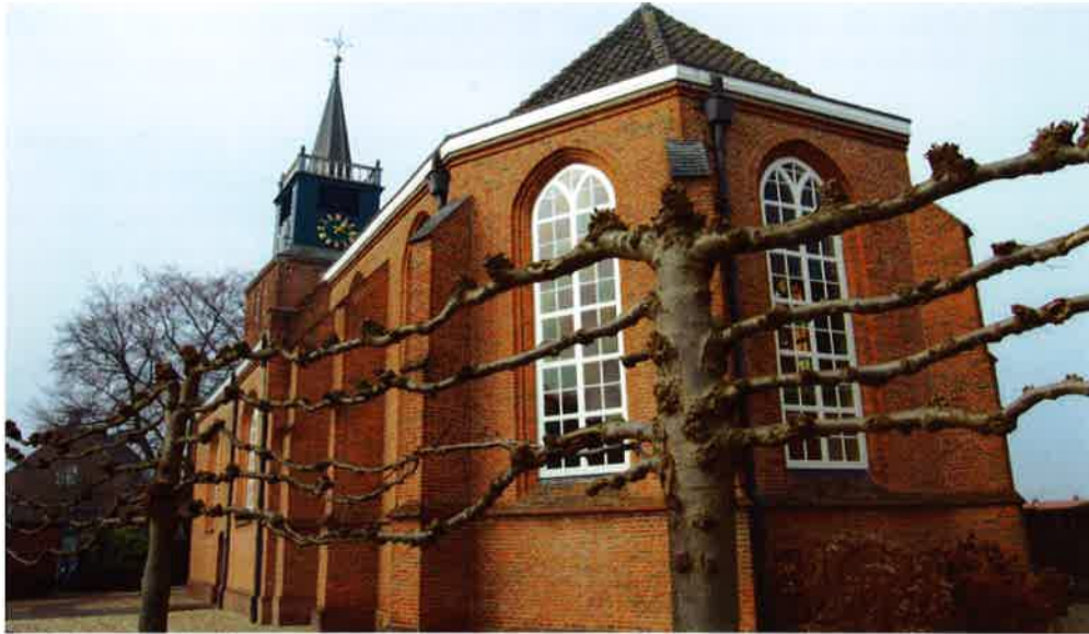
Kerkgebouw (1679) van de protestantse gemeente te Nigtevecht.

gedetailleerd in te gaan op zaken waarmee zij dagelijks als ouderling-kerkrentmeester te maken hebben.