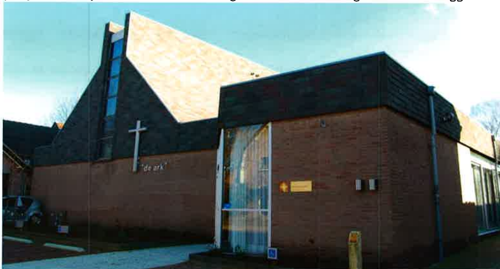
Gereformeerde kerk "De Ark" (1975) van Amerongen.

De brief stelt dat het afdelingsbestuur de meest geschikte gelegenheid is om als klankbord te fungeren. Mits goed geleid en opgezet zijn dit de plaatsen waar de meeste kerkvoogdijen bijeen zullen komen. Om te bereiken dat de band tussen hoofdbestuur en afdelingen nauwer wordt, zal het hoofdbestuur als regel eenmaal per jaar een bijeenkomst met de delegaties van de afdelingsbesturen beleggen.