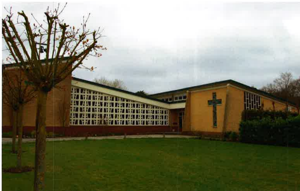
Vredekerk (1967) van de protestantse gemeente te Soesterberg.

hun weg hervinden en waarvoor zij bereid zijn diep in hun beurs te tasten, zodat de gemeente zo goed mogelijk haar taak kan uitvoeren.