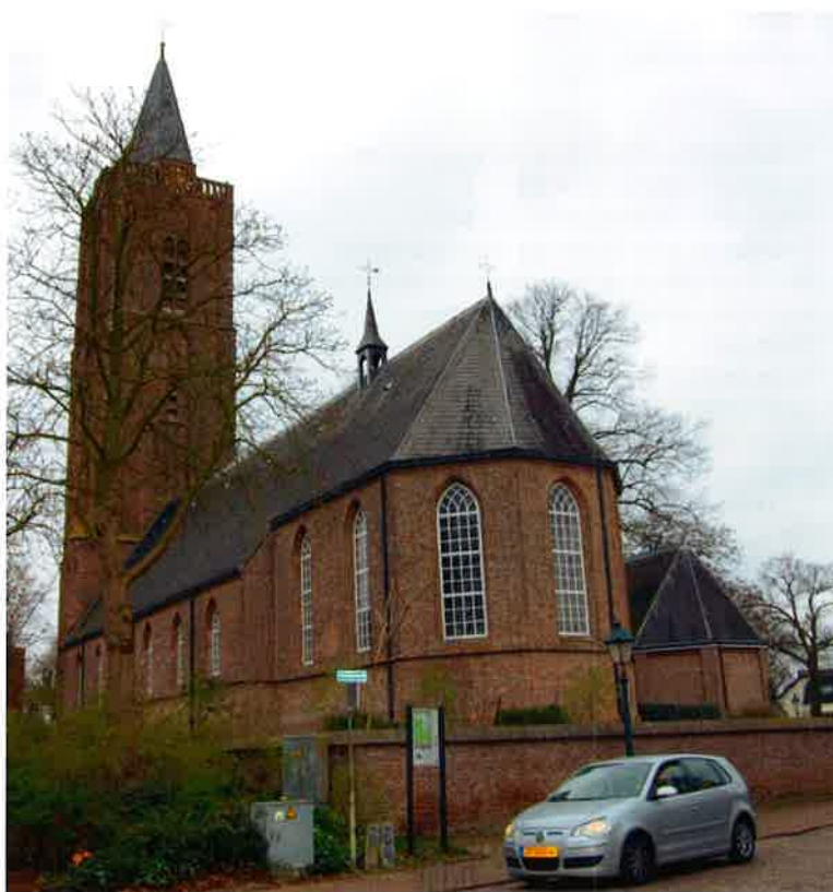
Oude kerk (15 e eeuw) van de protestantse ge- meente te Soest.

In mei 1976 besloot het moderamen van de generale synode van de Nederlandse Hervormde Kerk de kerkenraden te benaderen met een vragenlijst ten behoeve van de kerkelijke statistiek. De synode hoopte, nadat in eerdere jaren materiaalverzamelingen waren vastgelopen, op deze wijze een nieuw begin te maken met de jaarlijkse inzameling van gegevens. De Beleidscommissie voor de kerkelijke statistiek rapporteerde vervolgens naar aanleiding van de ontvangen antwoorden.