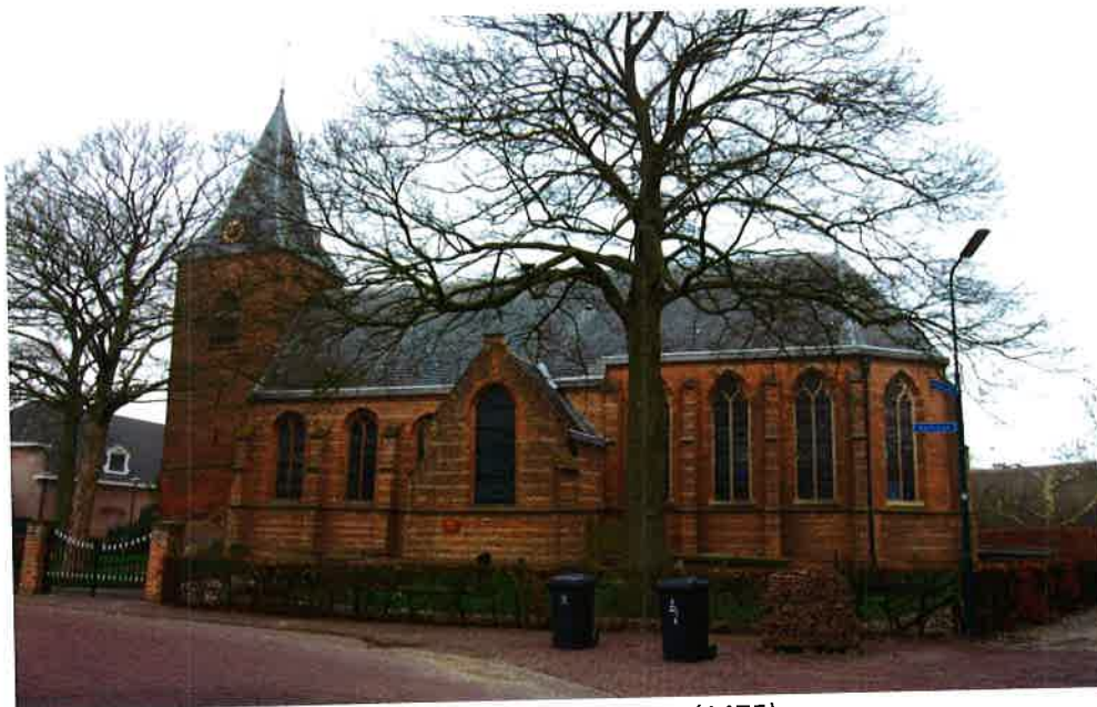
Kerkgebouw hervormde gemeente Nieuwer Ter Aa (1475).

In het dorp Nieuwer Ter Aa stond een kasteel, het huis Ter Aa. Dat was de woonplaats van de heer van Ter Aa, die eeuwenlang tevens de bestuurder was van de gerechtsheerlijkheid Ter Aa, bestaande uit het dorp en de naaste omgeving ervan. In 1673 werd dat kasteel verwoest. De heer van Ter Aa nam kort daarna zijn intrek in het huis Quackenburg dat op het kasteelterrein was gebouwd. De gerechtsheren en -vrouwen kwamen tussen het midden van de 11 e eeuw en 1864 achtereenvolgens uit de families Van der Aa, Van Renesse van der Aa en Van Reede van Ter Aa. De opvolging van deze geslachten werd bepaald door vererving.