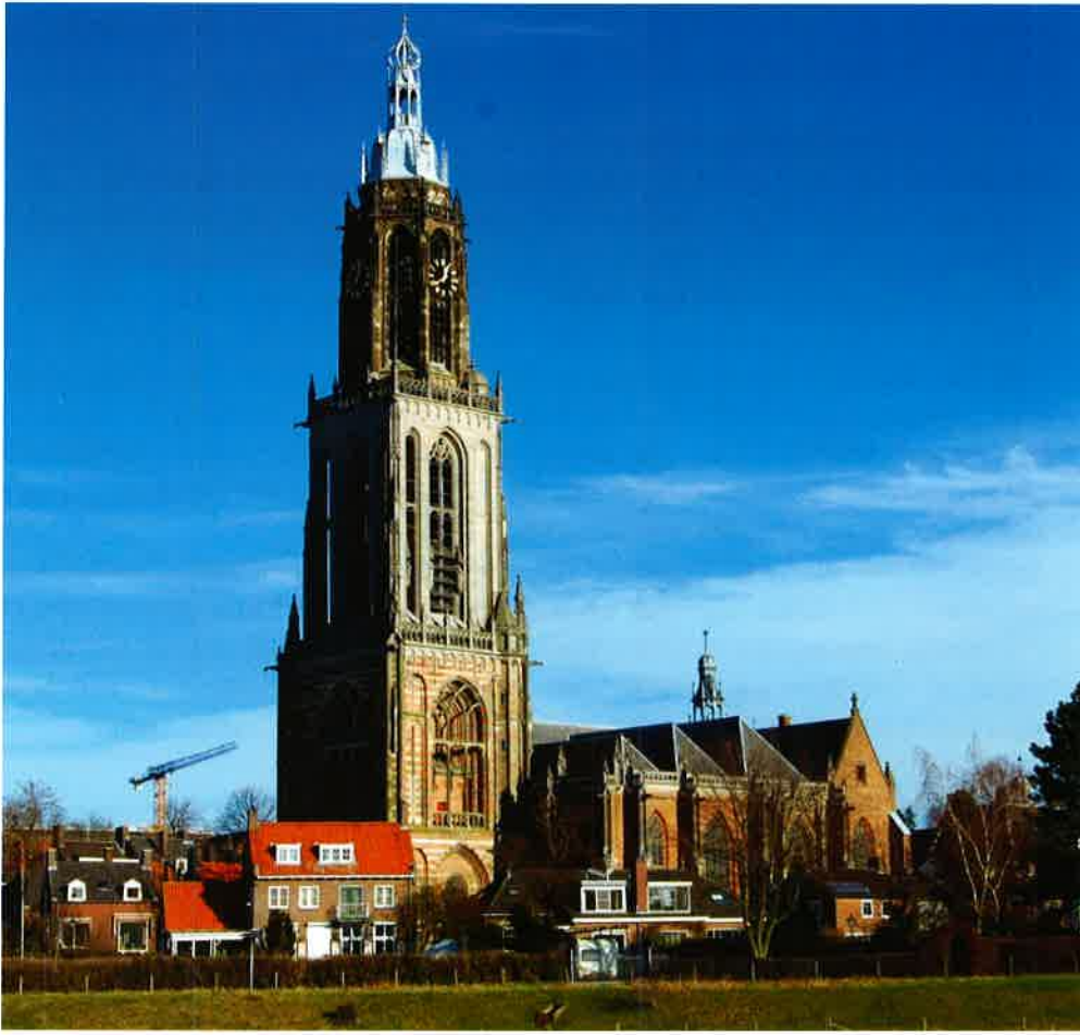
Cunerakerk (1428) van de protestantse gemeente te Rhenen.

de kerk weer in gebruik was genomen, beschikte de gemeente toen weer over een nieuw orgel. Dank werd gebracht aan de plaatselijke orgelcommissie die door collecten en door andere acties een bedrag van f 40.000 bijeen had gebracht.