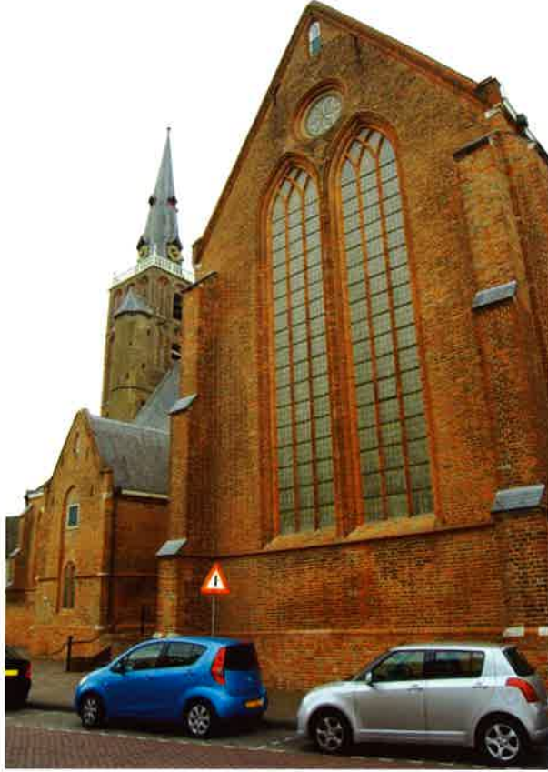
Grote of St. Janskerk (16 e eeuw) van de hervormde gemeente te Montfoort.

paus is dat hij over de Waldenzen als volgt oordeelde: "Te wapen, en trap deze ketters onder de voet als giftige slangen." Ook was hij de stuwende kracht achter de heksenprocessen.