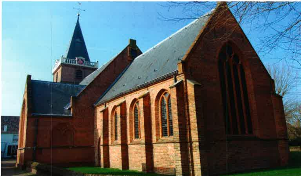
Nicolaaskerk (13 e eeuw) van de protestantse gemeente Vreeland.

Op de najaarsvergadering die op zaterdag 25 oktober 1958 om 14.30 uur in het