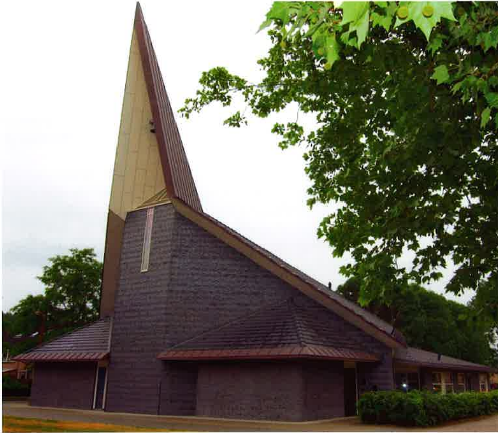
Kerkgebouw "De Rank" (2008) van de protestantse gemeente Nieuwegein-Zuid.

Hoogevest. De hervormde wijkgemeente Dijkveld en de gereformeerde kerk van Nieuwegein-Zuid zijn sinds 1986 met elkaar verbonden in het Samen-op-Weg proces, maar sinds 1969 werkten zij al samen. Die samenwerking groeide uit tot één gemeente met één kerkgebouw, één kerkenraad en twee predikanten. In het voorjaar werd het besluit genomen de hervormde gemeente Dijkveld en de gereformeerde kerk van Nieuwegein-Zuid te verenigen tot de protestantse gemeente van Nieuwegein-Zuid.