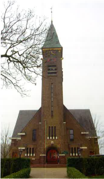
Kerkgebouw (1931) van de hervormde gemeente te Vinkeveen.