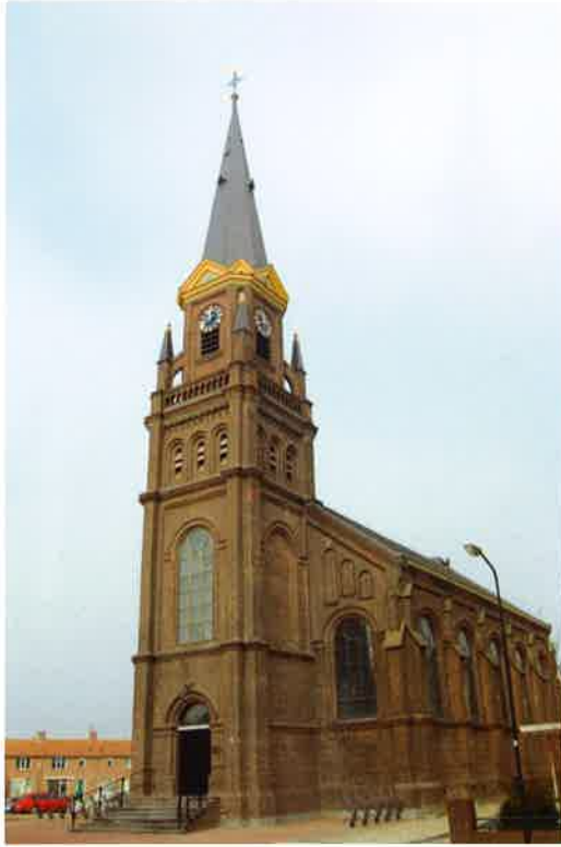
Hervormde kerk (1877) van Wilnis.