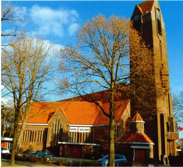
Nieuwe kerk (1927), ook wel "Bethelkerk" genoemd, van de hervormde gemeente Zeist.