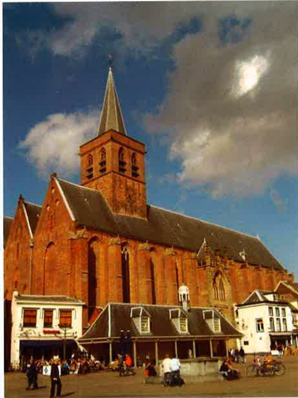
Sint Joriskerk (1284) van de protestantse gemeente van Amersfoort.

woedde er in Amersfoort een grote stadsbrand. In die tijd waren de meeste huizen uit hout opgetrokken, zodat een ergens beginnende brand snel om zich heen greep. Deze brand liet ook de Sint Joriskerk niet ongemoeid. Bij het herstel heeft men de hele noordwand moeten herbouwen.