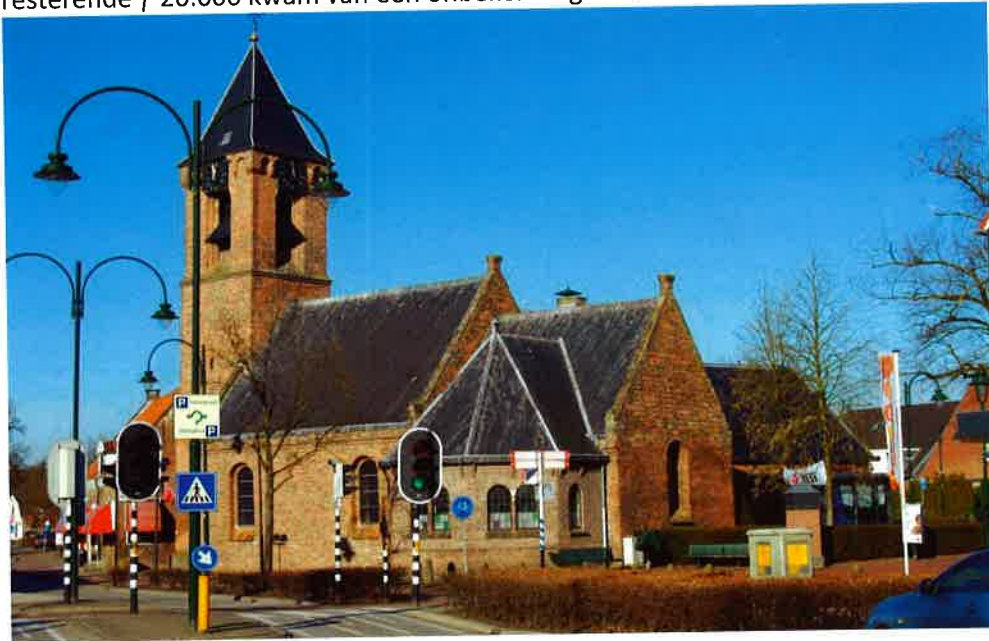
De Michaëlskerk (1300) van de hervormde gemeente te Leersum. Het kerkelijk centrum "De Kolk", dat in 1971 werd aangebouwd, is achter de kerk gelegen.

Op 11 september 1993 heeft kunstenares Annet Min het laatste gebrandschilderde raam van het kerkgebouw onthuld. Bij de restauratie van de kerk in 1958 werd, zoals hiervoor is vermeld, één van de gebrandschilderde ramen geschonken door de burgerlijke gemeente. De kosten van dit laatste raam, waarop het Pinksterfeest staat afgebeeld, bedragen f 45.000. Er was reeds f 25.000 toegezegd; de resterende f 20.000 kwam van een onbekende gever.