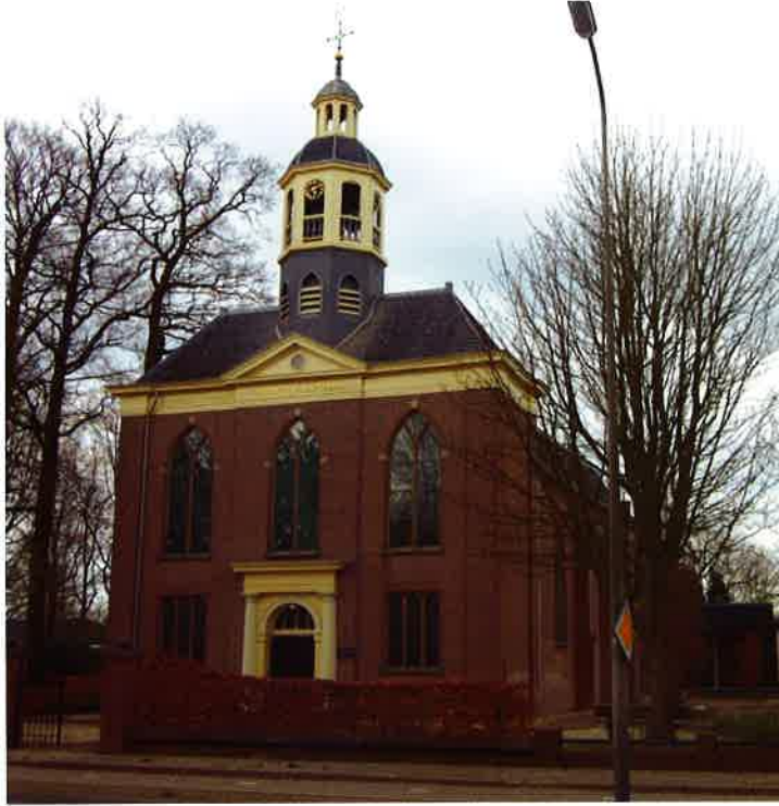
Dorpskerk (1828) van de protestantse gemeente Leusden.

Bij gemeenteleden moet helder voor ogen staan wat het beleid van de kerkenraad is en wat de daaraan verbonden kosten zijn. Maar al te vaak wordt er van uitgegaan dat de kerk door de overheid betaald wordt. Bij de Vereniging van Kerkvoogdijen, die ook in de Commissie Geldwerving verte-