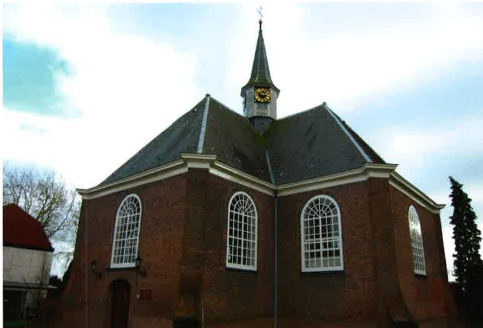
Dorpskerk (1683) hervormde gemeente Vreeswijk te Nieuwegein-Zuid.

Tenslotte werd besloten een werkcómité in te stellen bestaande uit de kerkvoogdijen van Amersfoort, De Bilt, Jutphaas en Rhenen. Uit de stukken blijkt niet welke opdracht het comité meekreeg, maar wellicht was zijn taak de in 1931 opgerichte afdeling, waarover sinds 1931 niets meer vernomen, nieuw leven in te blazen.