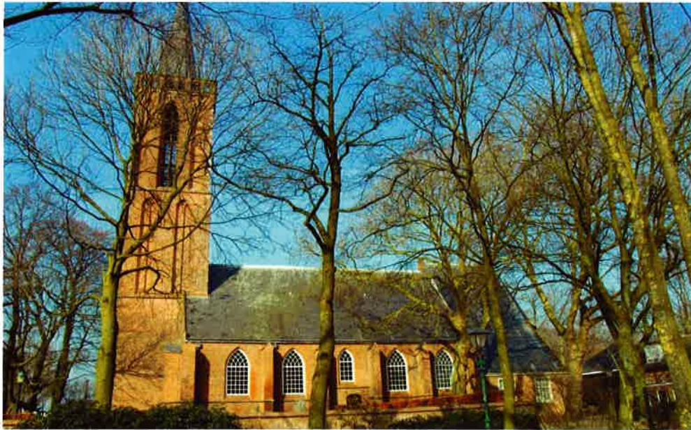
Sijpekerk (1400) van de hervormde gemeente te Nieuw-Loosdrecht.