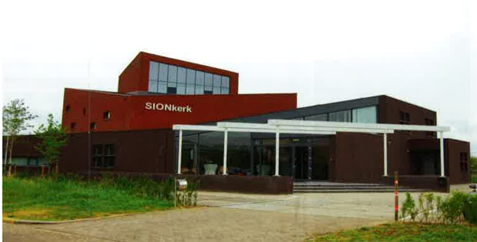
Sionkerk (2008) van de protestantse gemeente Houten.