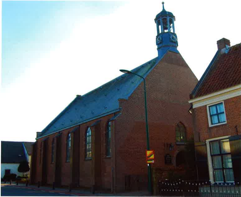
Hervormde kerk (1819) te Elst Utr.

De predikant werd aangesteld voor een bedrag van f 2.500, waarvan f 800 rijkstraktement, zodat f 1.700 ten laste van de hervormde gemeente bleef. De gemeente bleef in gebreke bij de betaling aan de predikant en toen de predikant in 1930 de gemeente verliet, was er een achterstand van f 3.200. De predikant dagvaardde zijn voormalige gemeente, met als gevolg dat eerst de Rechtbank en later het Gerechtshof de rechtmatigheid van de aanspraken van de predikant erkenden, zodat hem volgens uitspraak van het Hof een bedrag van ongeveer f 4.000 toe zou komen. De predikant liet beslag leggen op de eigendommen van de hervormde gemeente Elst Utr. Dit betrof de pastorie met tuin, het catechisatielokaal en de grond waarop de kerk is gebouwd.