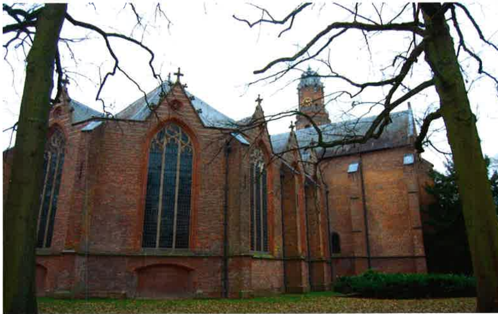
Nicolaaskerk (1310) van de hervormde gemeente te IJsselstein.