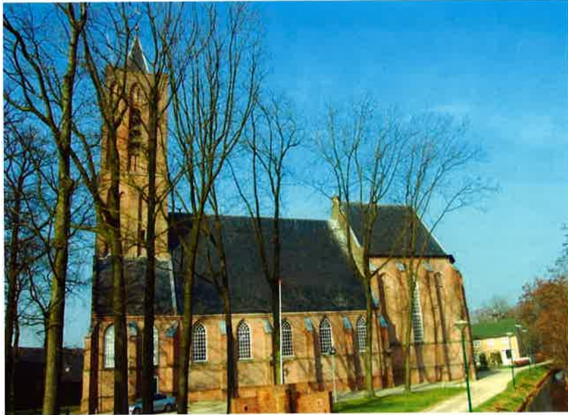
Hervormde kerk (1481) Westbroek.