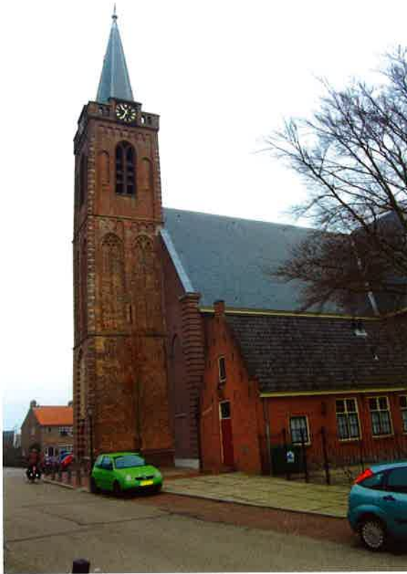
Kerkgebouw (1834) van de hervormde gemeente te Kamerik. De toren stamt uit de 15 e eeuw.