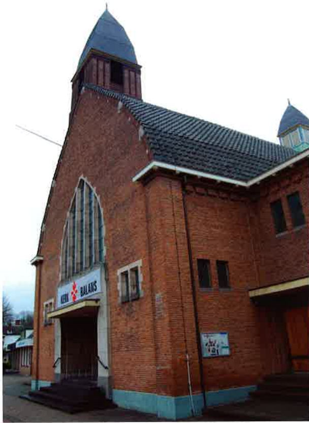
Grote kerk (1927) van de protestantse gemeente Driebergen.

op het terrein van "Kerk en Wereld". Door een honderdtal medewerkers werden alle hervormden bezocht, met als resultaat dat in mei 1963 de eerste f 100.000 aan toezeggingen en giften bereikt was.