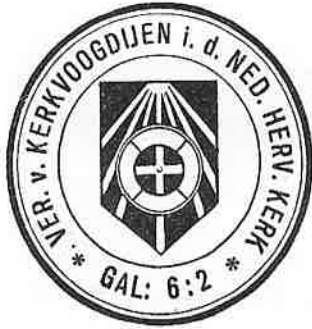
Logo VVK omstreeks 1930