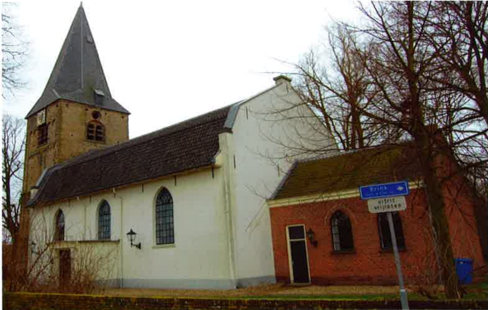
Sint Stevenskerk (1480) van de hervormde gemeente te Werkhoven.

Nederlandse Hervormde Kerk telde toen zo'n 3,5 miljoen leden (belijdende leden, doopleden en geboorteleden) en verkeerde toen nog in een groeisituatie. In 1957 waren er circa 1.000.000 leden (voornamelijk uit de grote en grotere gemeenten) bij de SMRA aangesloten. Rekening houdend met de groei die de Kerk toen meemaakte en de ontwikkeling naar een mechanische administratie, was de prognose van de SMRA op totaal zo'n 4 miljoen zielen gebaseerd.