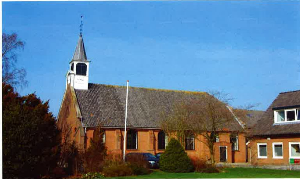
Kerkgebouw (1813) van de protestantse gemeente van Tienhoven (Utr.).

1998 te houden, waarbij dr. W.J. Diepeveen, oud-voorzitter van de Orgelcommissie van de Nederlandse Hervormde Kerk, een inleiding zal houden onder de titel "Ons rijke orgelbezit". De directeur van orgelbouwer Flentrop, de heer J.H. Steketee, zal iets vertellen over de restauratie van het Naberorgel en het onderhoud van orgels in het algemeen. Na afloop wordt er een broodmaaltijd gebruikt en is er de mogelijkheid om onder leiding van een gids een rondleiding door de kerk mee te maken. Het werd een zeer geanimeerde bijeenkomst, die door ruim 50 aanwezigen werd bijgewoond.