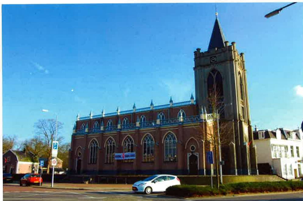
De Oude kerk (1843) van de hervormde gemeente te Zeist.

Verder zijn er tijdens de restauratie nog diverse vondsten uit de middeleeuwen gedaan. Ook de burgerlijke gemeente van Zeist verleende financiële steun aan deze restauratie.