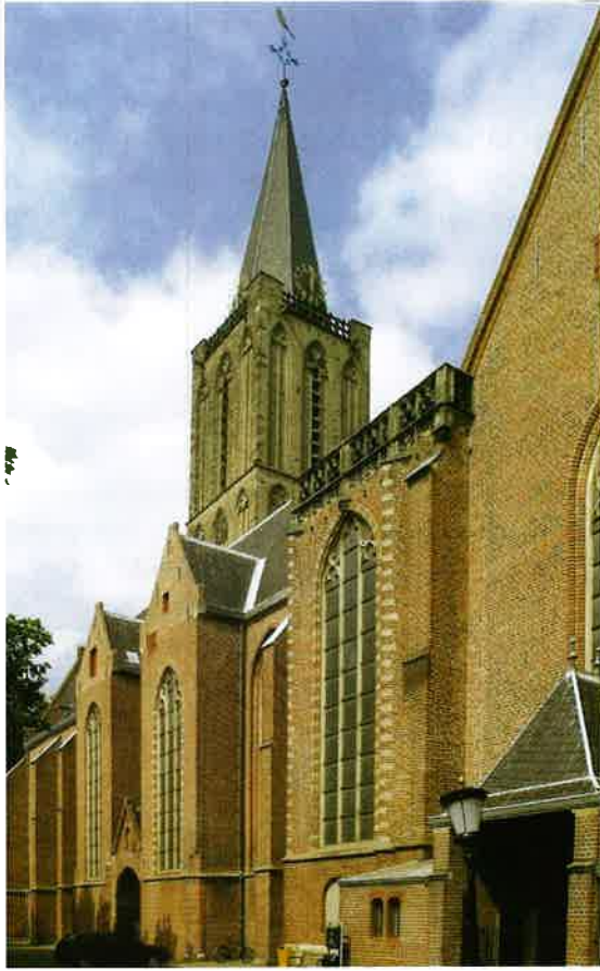
De Jacobikerk (14 e eeuw) van de hervormde wijkgemeente die deel uitmaakt van de protestantse gemeente van Utrecht.

golden, betalen alsmede een schadeloosstelling aan zijn eigen parochiekerk. Bij de begrafenis werd een zwart lijkkleed met een wit kruis gebruikt, een z.g. pel. De minder bedeeden huurden een pel van de kerk; de rijken lieten er zelf een maken, die na het gebruik volgens het kerkrecht aan de kerk verviel. Was de pel van een kostbare stof, dan lieten de kerkvoogden daarvan wel eens een misgewaad maken. Anders werd hij gebruikt voor nieuwe tabbaarden voor de kerkelijke beambten of voor kleding ter uitdeling aan de armen. Verder was er de aflaathandel.