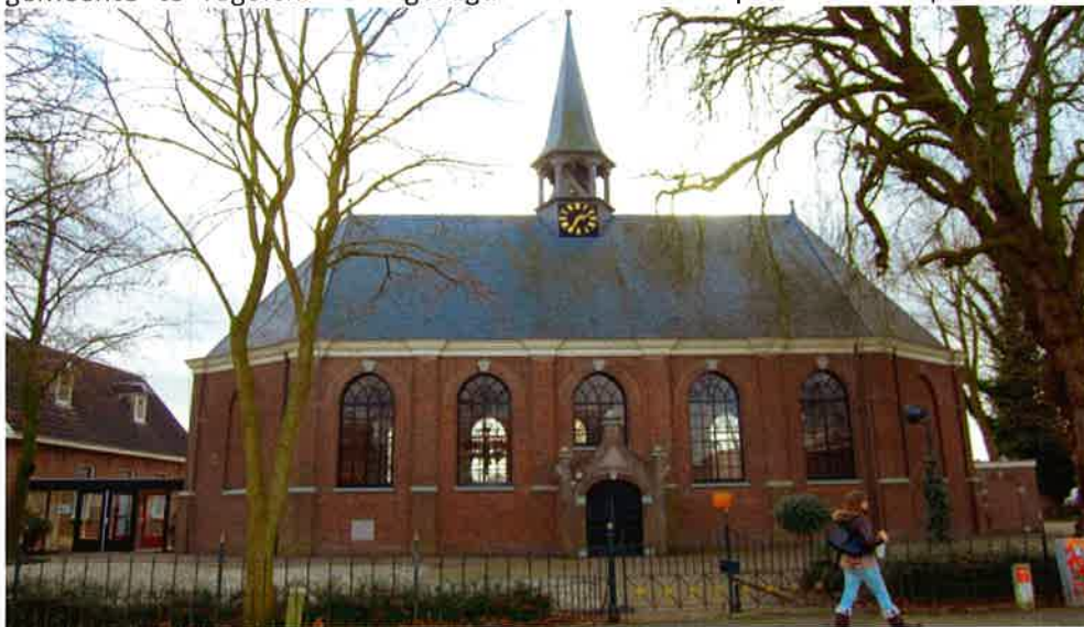
Dorpskerk (1820) van Nieuwegein-Noord, het vroegere Jutphaas.