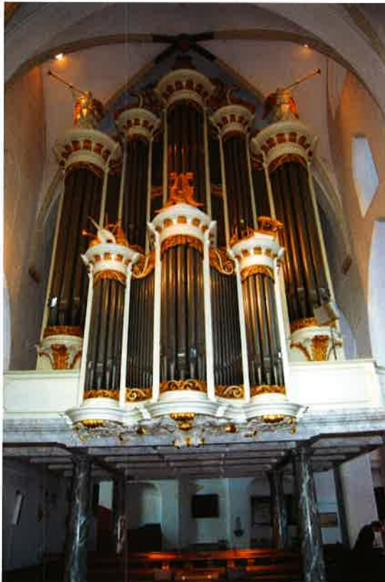
Het Naberorgel (1845) van de Sint Joriskerk van Amersfoort.

Het grote orgel dat in 1845 door Naber uit Deventer werd gemaakt, kreeg toen een plaats op het in Nederland unieke oksaal. In 1970 maakte het orgel na een restauratie een draai van 180°; het werd toen gesitueerd in het middenschip aan de westzijde van de kerk.