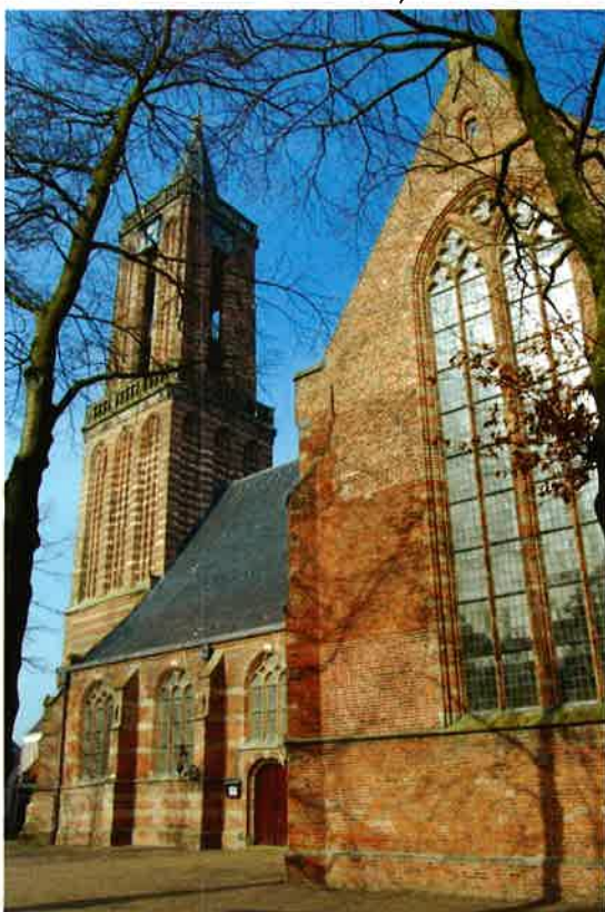
Grote kerk (1450) van de hervormde gemeente te Loenen aan de Vecht.

Op de ledenvergadering van de afdeling die op 22 maart 2000 in gebouw "De Voorhof" te De Bilt plaatsvond, hield de secretaris van de Vereniging, mr. B. van den Broek, een inleiding over de noodzaak van een quotisatieregeling en het nut van deze regeling. Hij wees er op dat er een samenhang is met de kerkstructuur, namelijk het synodaal-presbyteriaal kerkverband waar de ambten "de dienst" uitmaken. Voor de noodzakelijke continuïteit is het belangrijk dat er een bovenplaatselijke organisatie is die het werk van de vrijwilligers en de plaatselijke beroepsmensen (predikanten) ondersteunt. Deze ondersteuning kost geld en dat geld moet door de gezamenlijke leden van de kerkelijke gemeenten, dus in wezen alle gemeenten bij elkaar, worden opgebracht. Bij de verdeling kan gedacht worden aan een bedrag per lid, maar dan krijg je een lastige discussie omdat niet alle leden actief zijn in het betalen van hun kerkelijke bijdrage (de z.g. nulbetalers). Bij de quotisatieregeling die voor de nieuwe kerk (fusie van de