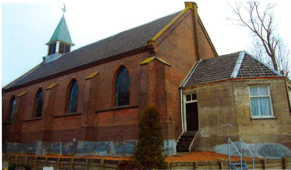
Kerkgebouw (1887) van de hervormde gemeente te Waverveen.