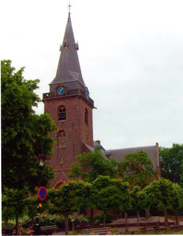
Kerkgebouw (1425) van de hervormde gemeente te Harmelen.

Amersfoort, vervolgens als bestuurslid van de afdeling en lid van het dagelijks- en hoofdbestuur van de Vereniging van Kerkvoogdijen.