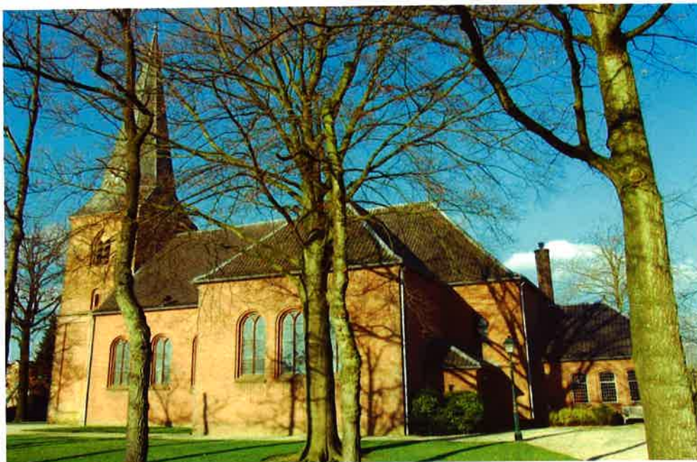
Kerkgebouw (14 e eeuw) van de hervormde gemeente te Woudenberg.