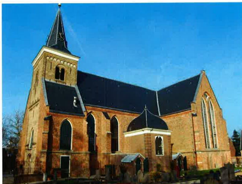
Dorpskerk (1519) van de hervorm- de gemeente te Maarssen.

met 500 zitplaatsen. Het geheel moest meer dan één functie vervullen. Door de Bouw- en Restauratiecommissie van de Nederlandse Hervormde Kerk werd een ontwerpplan opgesteld met als resultaat dat de bouwkosten op f 1.240.000 uitkomen. Men kon rekenen op een rijkssubsidie van 20 procent van de totale stichtingskosten mits het project vóór 1 maart 1975 werd aanbesteed en gegund. Dat gebeurde op 28 februari 1975. GFR en SSK zegden eveneens subsidie toe.