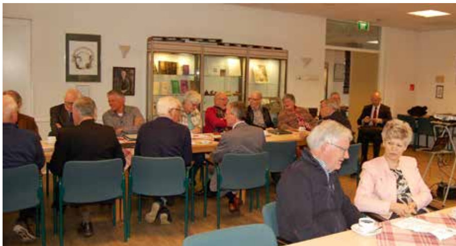
Indruk van de vergadering

Steeds meer colleges van kerkrentmeesters klagen over het feit dat het ieder jaar moeilijker wordt om Kerkbalanslopers te benaderen. Ook hier is sprake van vergrijzing die voor de organisatie van de actie Kerkbalans verstrekkinge gevolgen kan hebben. Er zijn mogelijkheden om bij een deel van de gemeenteleden de toezegging voor Kerkbalans te digitaliseren. SKG Collect kan toezeggingen en bijdragen automatisch verwerken in de bijdragenadministratie van de gemeente van LRP of Scipio. Dit bespaart veel tijd en kosten en legt veel minder beslag op de vrijwilligers. De methodiek wijkt eigenlijk niet af van de huidige benadering met een intekenformulier dat geprint is. Ook de mogelijkheid van gespreide betaling is aanwezig.