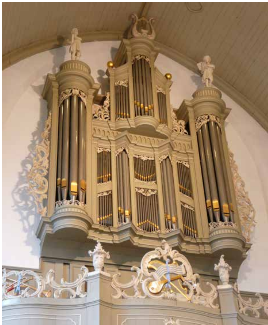
Van Oeckelen orgel Lutherse Kerk Delft

Op zaterdag 22 oktober jl. liet de Lutherse gemeente van Delft haar Van Oeckelen-orgel na een deelrestauratie door Orgelmakerij Reil b.v. (Heerde) weer horen.