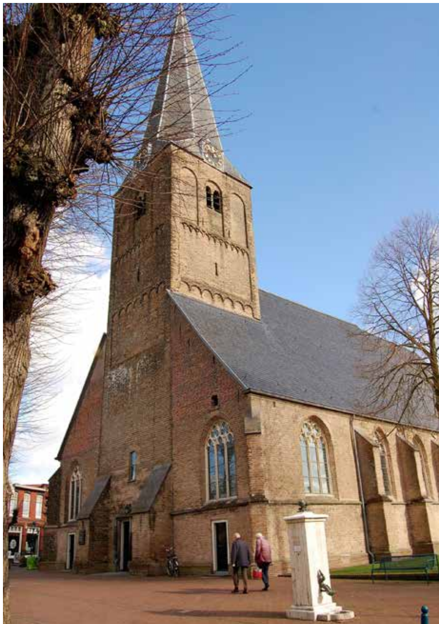
Grote kerk van Epe

Hervormde Kerk onder meer bekend als secretaris van de Raad voor de Zaken van Kerk en Israël. Hij was destijds ook predikant van de Hervormde gemeente te Epe en tot aan zijn overlijden woonachtig in Epe. Op 29 februari 2016 kwam hij als gevolg van een noodlottig ongeval om het leven, vlak bij de Grote kerk die hem lief en dierbaar was.