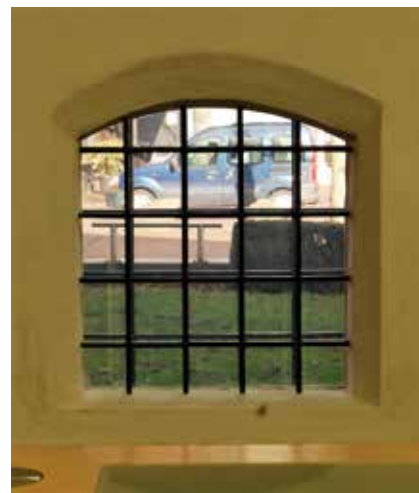
Hagoscoop volledig doorzichtig

De hagoscoop is een onderdeel van de middeleeuwse kerk in Epe. In een brochure van de Rijksdienst voor het Cultureel Erfgoed uit 2012 wordt onder het kopje: Architectuur en