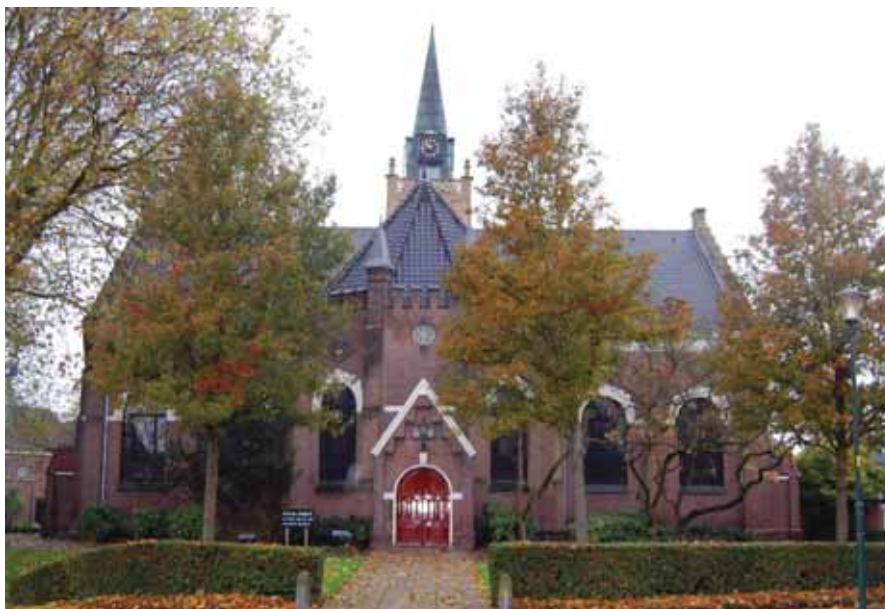
Kerkgebouw hervormde gemeente 's-Gravendeel.

de gemeenteleden die bij de lopers in de bus doen. De enveloppen moeten dus niet met de post naar het kerkkantoor. Volgens de heer De Zeeuw is dat zo belangrijk omdat de lopers dan weten wie hebben gereageerd, maar ook wie niet hebben gereageerd. Aan de laatste groep kan dan meer aandacht worden besteed. De heer De Zeeuw is nu zo'n vier jaar voorzitter van het college. Vroeger, zo gaat hij verder, werden de enveloppen niet opgehaald, maar moesten de gemeenteleden zelf zorgen voor het terugsturen. Dat werkte niet altijd. Een behoorlijk aantal kwam niet terug. Door er wat meer aandacht aan te geven, is de opbrengst behoorlijk gestegen. Al die extra inspanningen worden door de lopers graag gedaan als je ze maar enthousiasmeert, weet De Zeeuw. Als ze zien dat het werkt en dat er resultaten zijn, worden de vrijwilligers vanzelf enthousiast. Voor die wijzigingen ondervond hij niet veel weerstand binnen het college of de algemene kerkenraad. "Je moet een goede klik met elkaar hebben en anders moet