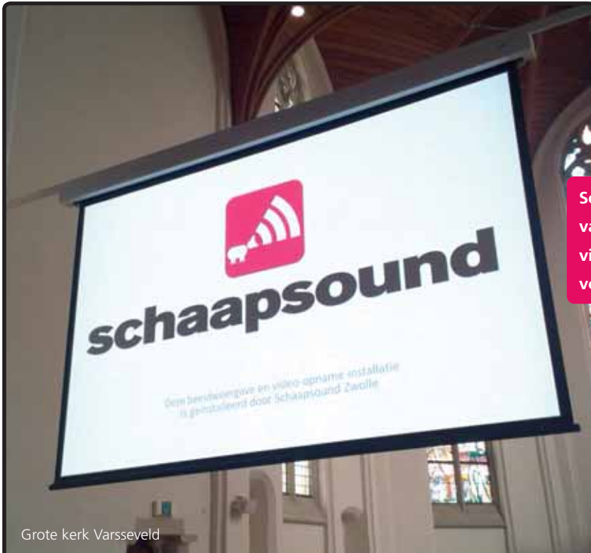
Grote kerk Varsseveld

Een goede verstaanbaarheid in de kerk is niet altijd eenvoudig te realiseren. Door een veelheid aan akoestische factoren is het nodig een professionele en ervaren partner in te schakelen.