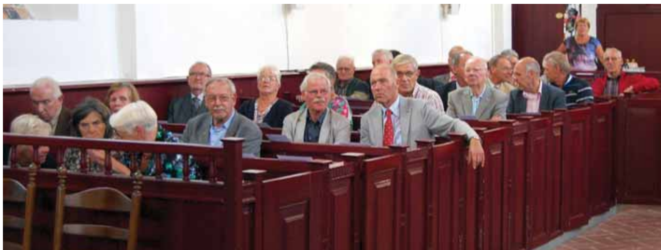
Verschillende genodigden bezochten de jubileumbijeenkomst.

Wittewierum (2003) die door veel personen werd bezocht. Tenslotte waren ook de vorming van de Protestantse Kerk in Nederland (mei 2004) en per 1 januari 2005 de fusie van de Vereniging van Kerkvoogdijen en het Landelijk Verband van Commissies van Beheer belangrijke momenten voor de afdeling Groningen.