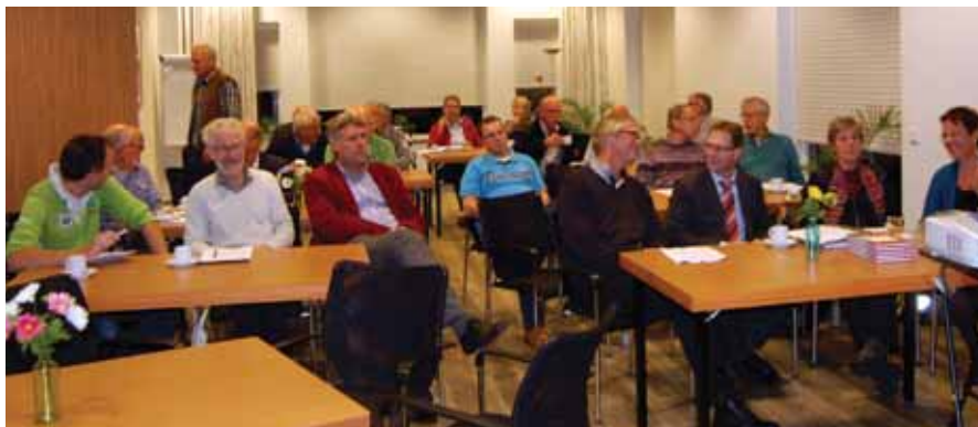
De aanwezigen tijdens de regiobijeenkomst in Zuidhorn.

Op de bijeenkomst waren ook twee consultants (mevr. Y. Nijlusing en de heer T. Heyne) van het Museumhuis Groningen aanwezig die bij het