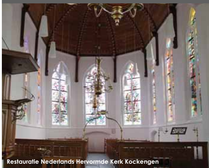
Restauratie Nederlands Hervormde Kerk Kockengen

Lakerveld ingenieurs- & architectuurbureau BV architectuur · instandhouding · onderhoud · bouwhistorie