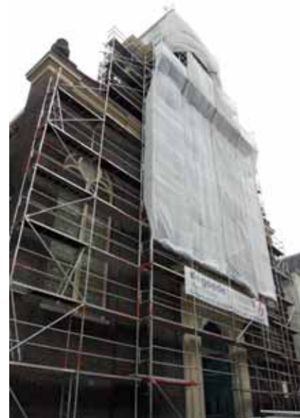
De kerk die begin juli 2013 in de steigers stond.

De geboren Drent belde met het stadskantoor en hoorde dat de gemeente wel een aantal ideeën had, maar dat het nog te vroeg was om spijkers met koppen te slaan.