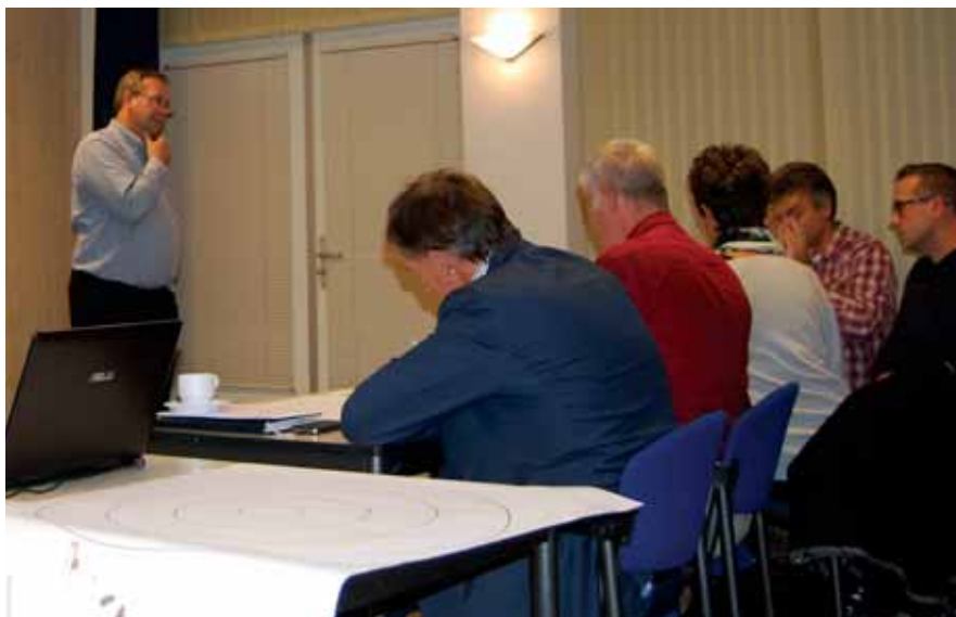
De workshop op 30 oktober 2013 in Tholen.

Op deze trainingsavond waren kerkrentmeesters uit Bruinisse, Burg-Haamstede, Dinteloord, Tholen, St. Annaland en Zierikzee aanwezig. Op de tweede avond (17 oktober 2013) werd dieper ingegaan op de communicatie en werd de deelnemers verzocht hun eigen materiaal (folder, brief e.d.) mee te brengen die de afgelopen jaren in het kader van de actie Kerkbalans gebruikt zijn.