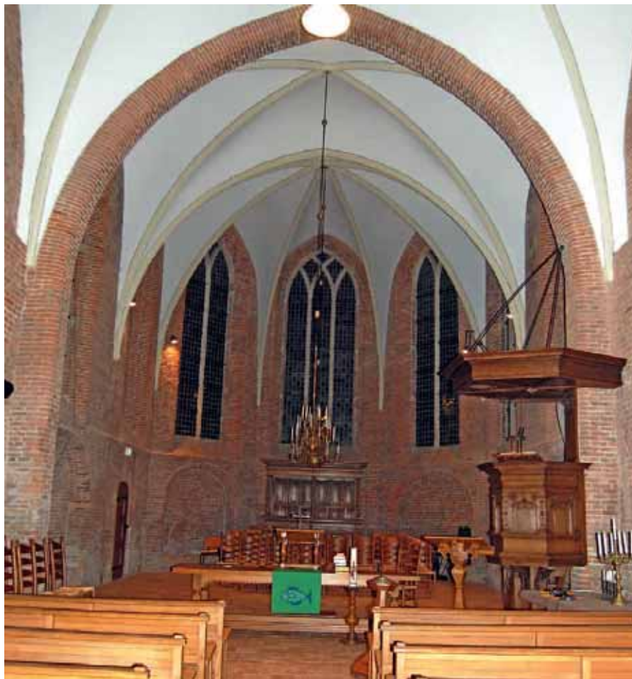
Interieur van de Clemenskerk van de protestantse gemeente van Havelte.