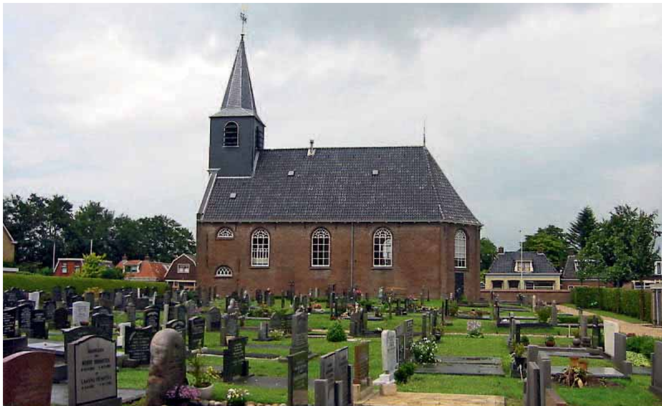
Kerkelijke begraafplaats van Hardegarijp.