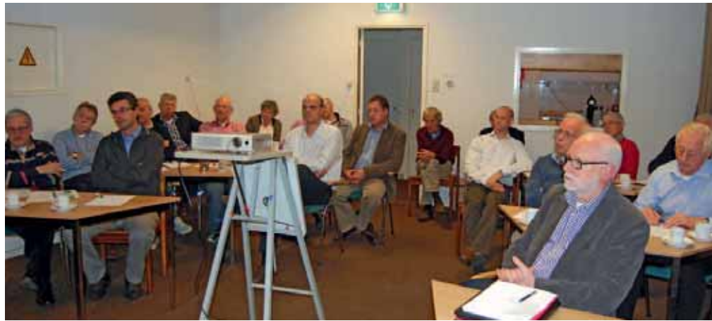
De bijeenkomst in Loenen aan de Vecht.