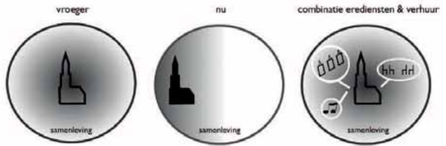
Plaats van het kerkgebouw in de samenleving

Een duidelijke communicatie en een zorgvuldige selectie van mogelijke huurders is zeer belangrijk, evenals het besluit over aanpassingen. Samen met de kerkrentmeesters wordt een selectie gemaakt van organisaties die mogelijk interesse hebben in het huren van de kerk en waarvan de activiteiten passend zijn. Kort gezegd: de activiteiten mogen niet in strijd zijn met de christelijke