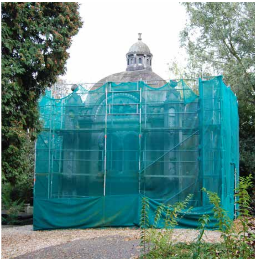
Zo stond het monument op de begraafplaats Oud-Kralingen er enkele jaren geleden bij

Het waren in feite de fundamenteën en overblijfselen van de uit 1550 stammende kerk, die in ca. 1850