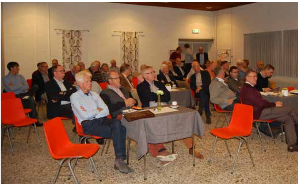
De aanwezigen in Alphen aan den Rijn

de kaders van de onderhoudstermijnen en breng de beschikbare budgetten in beeld.