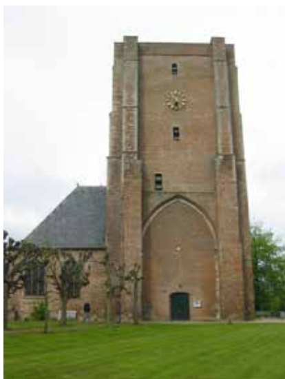
Kerk van de protestantse gemeente Sint Anna ter Muiden-Sluis

De SCEZ komt tot de conclusie dat de veertig onderzochte kerken in Sluis niet allemaal kunnen blijven bestaan – nu al heeft de helft niet langer een religieuze functie. Het vinden van een herbestemming voor alle af te stoten bedehuizen is een illusie, meent de SCEZ. Door de sterk vergrijzende bevolking van krimpge-