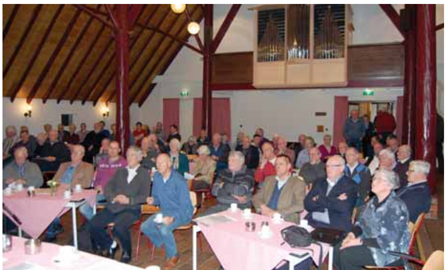
De aanwezigen tijdens de afdelingsvergadering in de Kerkboerderij van Haren.

2 e Lijn. Wij dienen kerk te zijn van ons eigen dorp. Vaak bestaat de verleiding om samen te gaan met