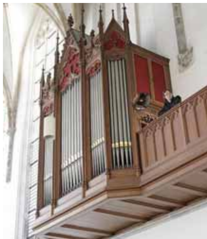
Het uit 1861 daterende Bätz-Witte-orgel in de Janskerk te Utrecht.

gebleven. In veel steden werden op weekdagen bespelingen gehouden. Uiteindelijk werd dat ook door kerkelijke overheden gesteund. Met als gevolg dat na enige tijd voor en na de kerkdiensten orgelspel klonk.