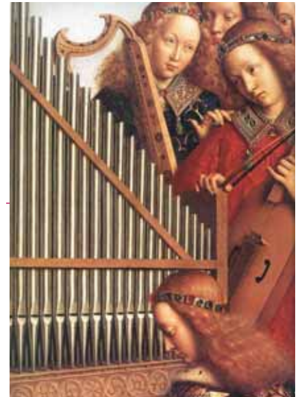
Een van de oudste geschilderde afbeeldingen waarop een orgel voorkomt, is 'De aanbidding van het Lam Gods', in 1432 door Jan van Eyck voltooid in de Josse Vijdkapel, Sint Baafskathedraal te Gent. Paneel van de musicerende engelen.