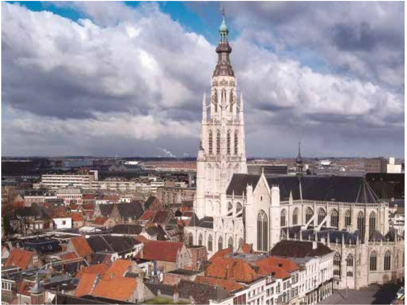
Grote kerk Breda

„Welkom in de grootste Nassaukerk van Europa”, roept een banner bij de ingang het winkelend publiek toe. Hier, in de Grote Kerk van Breda, liggen alle leden van het huis Nassau vóór Willem van Oranje begraven. Actie tegen verval van het rijksmonument is echter dringend nodig, zo meldt het Reformatorisch Dagblad van 5 november vorig jaar. Hoog torent de Grote of Onze-Lieve-Vrouwekerk boven de stad uit. Dat “Onze-Lieve-Vrouwe” – Maria – dateert nog uit de tijd voor 1637. In dat jaar kwam het gotische bedehuis definitief in handen van de protestanten. Nog altijd komt de Protestantse Gemeente van Breda, eigenaar van de kerk, er ‘s zomers en op kerkelijke hoogtijdagen bijeen. De rest van het jaar maakt zij gebruik van andere kerkelijke gebouwen.