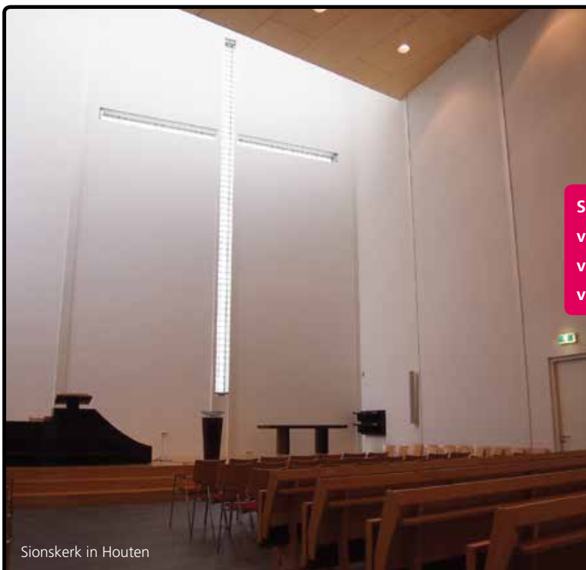
Sionskerk in Houten

Een goede verstaanbaarheid in de kerk is niet altijd eenvoudig te realiseren. Door een veelheid aan akoestische factoren is het nodig een professionele en ervaren partner in te schakelen.