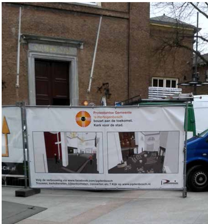
Grote Kerk van de Protestantse Gemeente 's-Hertogenbosch begin mei dit jaar

De protestantse gemeente in Brabants hoofdstad heeft de blik