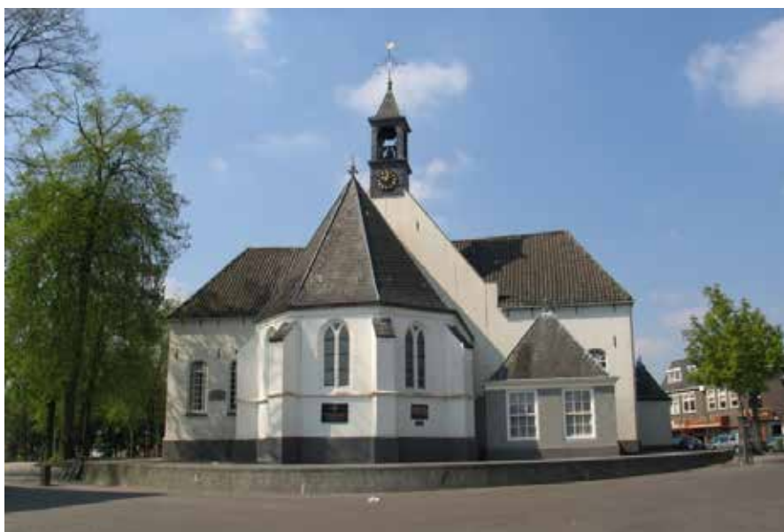
Oude Kerk aan de Markt van de hervormde gemeente Veenendaal

In het weekend van 10 juni jl. heeft de hervormde gemeente Veenendaal uitgebreid aandacht besteed aan het 450-jarig bestaan van de Oude Kerk van Veenendaal. Op 12 juni is er een jubileumdienst gehouden, terwijl er op 10 en 11 juni diverse evenementen plaatsvonden in en rondom de kerk. In het koor van de kerk was er een tentoonstelling over de Oude Kerk te zien, terwijl er op zaterdagmorgen 11 juni een bijeenkomst voor senioren werd georganiseerd met zang en verhalen over de historie van de kerk. 's Middags was er voor de kinderen een poppenspeler en 's avonds was er een bijeenkomst met zang, optreden en een verhaal. Die dag werd afgesloten met een discussie waarin theologen en historici zaken rondom kerk en maatschappij bespraken.