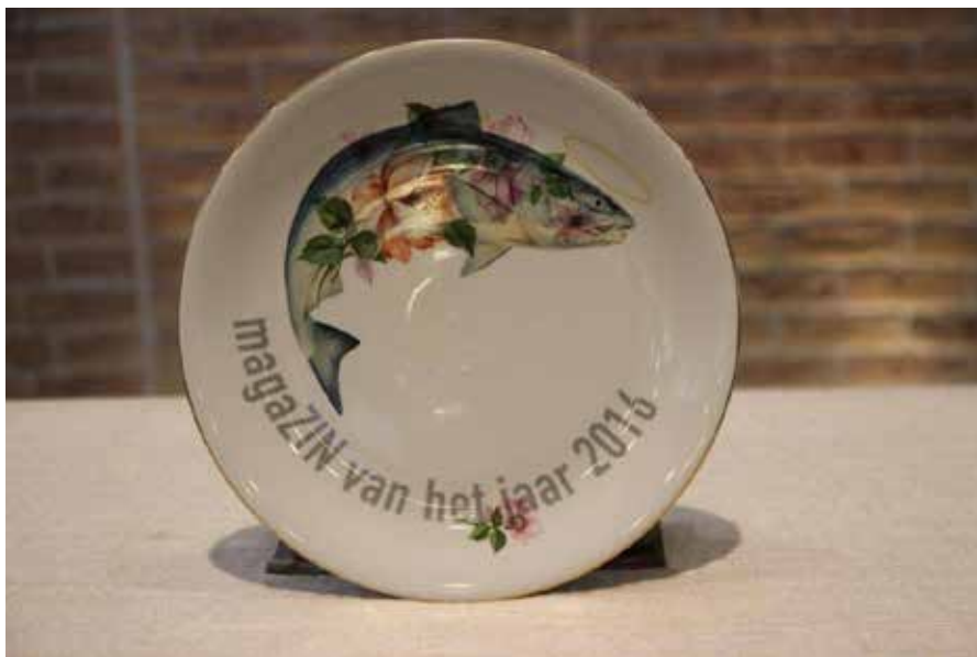
De Zalige Zalm bokaal

Het kerkblad van de toekomst is een full colour tijdschrift en lijkt in niets meer op de gekopieerde blaadjes van vroeger. KerkmagaZIN is ook