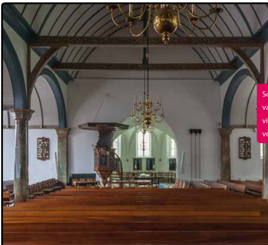
Veenendaal, Oude Kerk

Colleges van kerkrentmeesters die al verschillende jaren met krimp te maken hebben, worden geconfronteerd met reorganisatie, herinrichting van de kerk en dan komt de vraag naar boven: wat is van belang