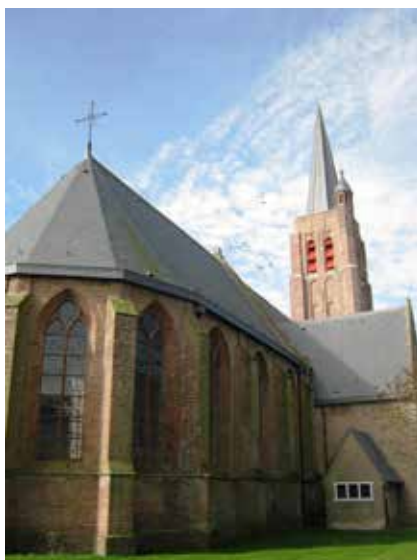
Kerk van de protestantse gemeente Nisse

Voor de jaarlijkse rommelmarkt in Nisse loopt het gehele dorp uit. Dat was ook dit jaar het geval, want 's morgens om 8.00 uur gingen de circa 80 vrijwilligers van start om alles uit te stallen. De rommelmarkt begint om 13.00 tot 16.00 uur. Veel goederen worden bij opbod verkocht en daarna worden de niet verkochte goederen via het Rad van avontuur van de hand gedaan. "Enkele jaren