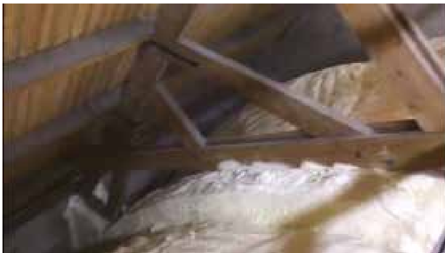
Isolatie van een kerkzolder met PUR-schuim

Muurisolatie heeft bij kerkgebouwen doorgaans een beperkte meerwaarde omdat massieve kerkmuren van 60 à 70 centimeter dik op zich al relatief goed isoleren. Verder beperkt de cultuurbehoudsfactor meestal de mogelijkheden voor gevelisolatie, zowel aan interieurzijde als aan de buitenkant. In geval van muren met binnenbepoetsing – die vervangen moet worden – zijn er wel goede mogelijkheden. Een voorbeeld is kalkgebonden isolerende pleistermortel, waarmee met behoud van maat en beeld van de oude gepleisterde binnenafwerking een redelijke isolatiewaarde kan worden bereikt.