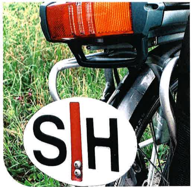
Bordje aan een fiets waarmee kan worden aangegeven dat de bestuurder slechthorend is.

Ik heb de heer Te Winkel inmiddels kunnen vertellen dat wij de thematiek zullen oppakken. Ondertussen zullen we niet de website van KBB overnemen. Die is daarvoor te gedateerd en ook te onvolledig. Maar wat we wel van plan zijn, is aandacht geven aan de problematiek. Het opnemen in de jaarlijkse agenda voor kerkrentmeesters: doe regelmatig een gehandicaptenvriendelijkheidscheck. We gaan daarvoor een handzaam zelftestprotocol (laten) ontwikkelen. We zullen