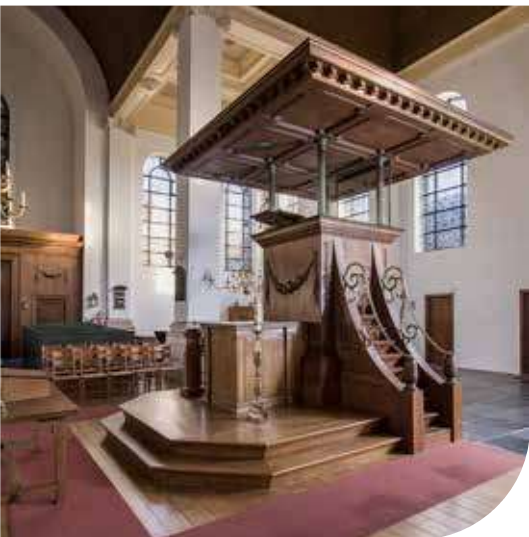
Preekstoel in de Nieuwe Kerk te Haarlem

Verantwoordelijk voor geld en goed; u hebt als kerkrentmeester een belangrijke en veelomvattende taak. Die voert van verzekeringen en investeringen tot onderhoud en renovatie. Uw werk staat in dienst van de eredienst, de waarden en idealen van uw gemeente. En ondanks de actuele tendens van 'Kerk naar buiten', richten we onze blik in deze uitgave van Kerkbeheer naar binnen. Kerken zijn immers gemaakt voor de binnenkant. Daar vieren we de eredienst en ten behoeve van die eredienst werd het kerkinterieur aangekleed met sierlijk vormgegeven meubels, kunstwerken en liturgische voorwerpen.