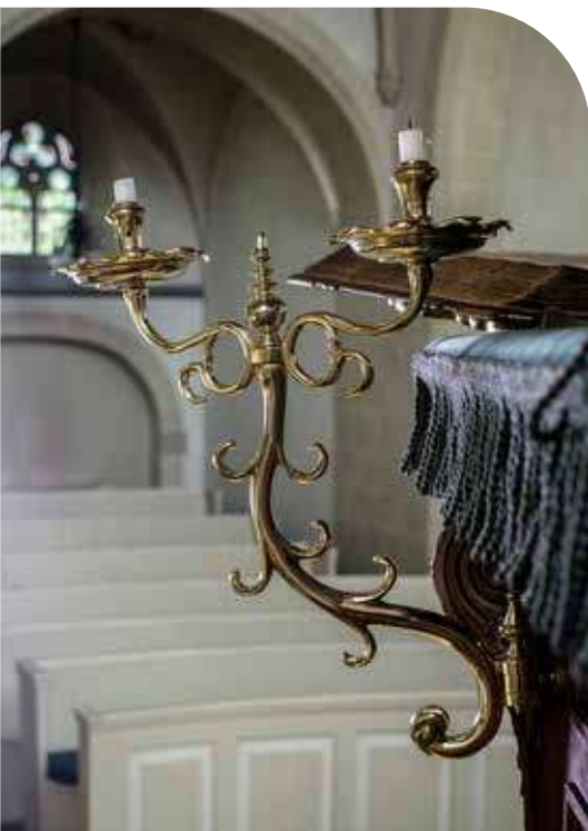
Ludgeruskerk te Hall

dacht of ontdekt u dat uw kerk voorheen eigenaar was van een schilderij dat er nu niet meer is. Of misschien merkt u op dat uw collectie meer dan 25 jaar geleden voor het laatst vastgelegd werd. Dan is het hoog tijd voor een actualisatie. Want zorg, bewustzijn en keuzes op het gebied van interieur en collectie beginnen met een goed overzicht van wat u beheert.