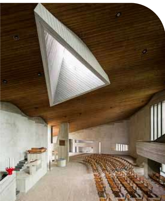
Thomaskerk te Amsterdam

en vrijwilligers minstens twee keer per jaar de poetsdoek en het poetsmiddel. Poetsen kan echter veel schade opleveren. De eerste stap in het onderhoud van dit prachtige, maar ook kwetsbare materiaal is evenwel het creëren van de juiste bewaaromstandigheden. Door omgevingsfactoren als vocht en tocht te vermijden, voorkomt u dat het zilver aanloopt (niet schadelijk, het patina is soms zelfs onderdeel van een kunstvoorwerp) of corrodeert (niet gewenst, kan leiden tot materiaalverlies). Zo hoeft u minder te poetsen: u draagt bij aan behoud van het waardevolle erfgoed en bovendien bespaart u tijd.