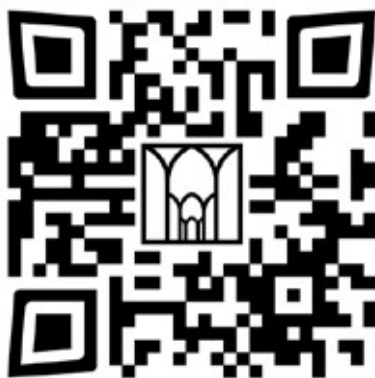
Scan deze QR-code met uw telefoon of tablet voor een informatiefilmpje over 'Het Grootse Museum van Nederland'

Is uw kerk trotse eigenaar van historisch zilver? Avondmaalschalen, -bekers en -kannen en doopschalen vervullen een belangrijke liturgische functie. De voorwerpen horen te glimmen, als onderstreping van hun waarde, maar ook als blijk van de zorg die besteed wordt aan het onderhoud van het kerkinterieur en zijn inventaris. In talloze kerken hanteren kosters