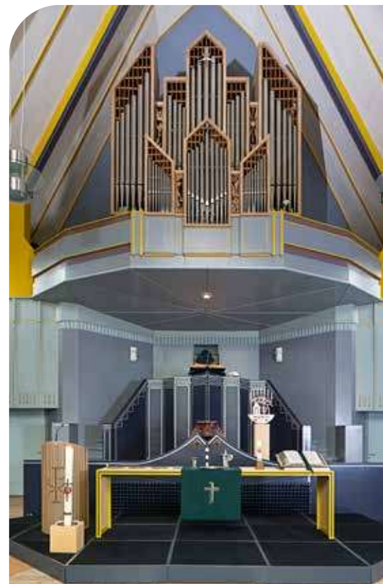
Ontmoetingskerk te Bergen op Zoom

voortgaand religieus gebruik ervan te kunnen garanderen. Dit kan betekenen dat voor een bepaalde architect kenmerkend meubilair wordt verwijderd, of een voor een bepaalde periode in de kerkgeschiedenis representatief type opstelling van de kerkbanken, een zogeheten bankenplan, wordt opgeofferd. De banken mobiel maken door er wieltjes onder te plaatsen kan een oplossing zijn voor behoud van een (deel van) de banken. De specialisten van Museum Catharijneconvent doen momenteel diepgaand onderzoek naar onder andere het belang en de typologie van kerkbanken. Wat is one-of-a-kind en wat is doorsnee? Wat moeten onze kinderen en kleinkinderen ook nog zien en wat hoeft niet bewaard te blijven?