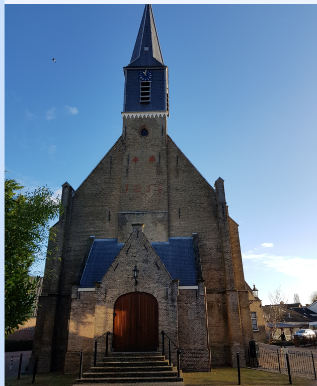
Herv. Kerk te Gouderak: Aanvraag onderhoudssubsidie (SIM) voor de jaren 2022 -2027