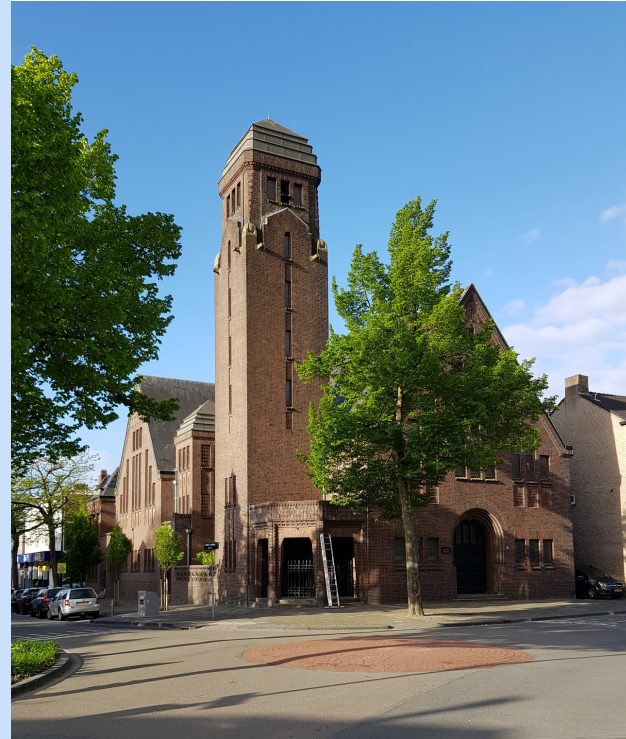
C.G.K te Dordrecht: Aanvraag onderhoudssubsidie (SIM) voor de jaren 2023 -2028