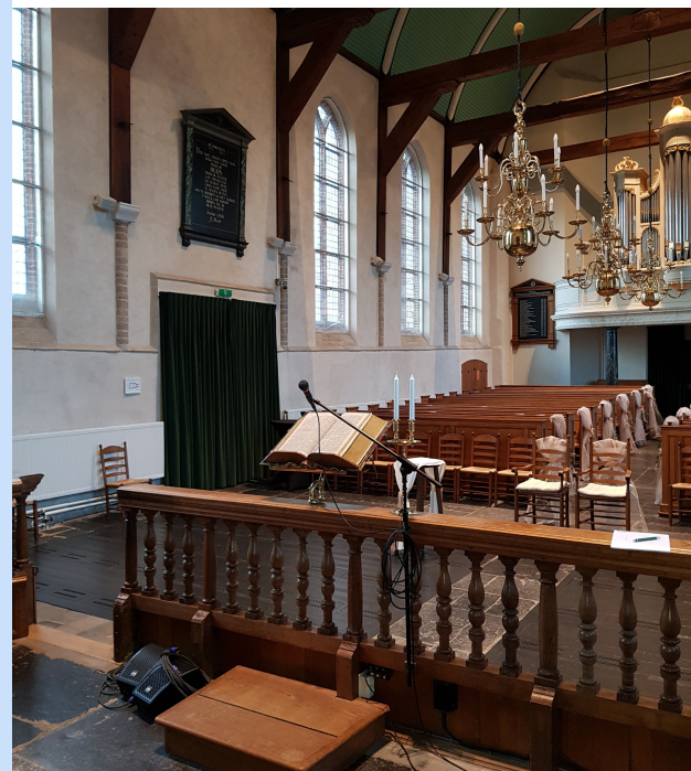
Dorpskerk te Giessen-Oudekerk: aanvraag onderhoudssubsidie (SIM) voor de jaren 2022 -2027