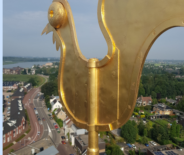
Grote kerk in Albasserdam: Inspectie daken, goten en toren m.b.t. status van onderhoud

Voor meer informatie en meer voorbeelden van geleverd werk zie: www.monumentplus.nl